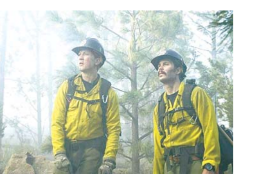
电影《勇往直前》剧照