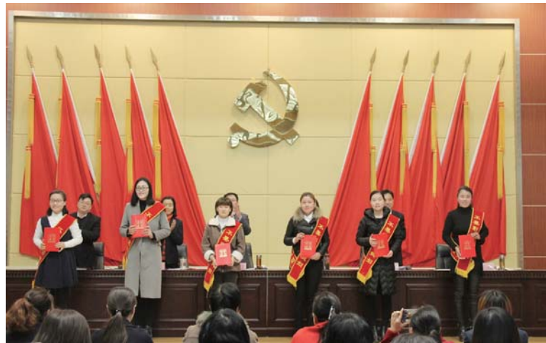
△杨店镇家家训教育展馆