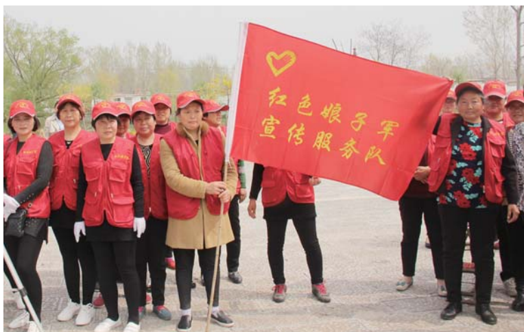
△次邱镇“以文化人”文艺演出