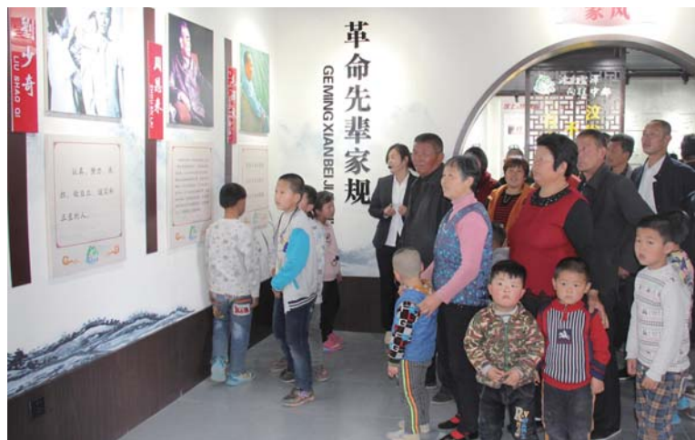
△千人倡议签名活动

还需要善于运用软的办法。”汶上县委宣传部相关负责人说。汶上县一方面通过设立红白理事会、完善村规民约等方式健全“硬”的机制，另一方面通过选树“不要彩礼的好媳妇”、开展“以文化人”工程等方式，为老百姓重建“软”的价值观念，收效显著。