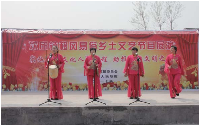
△汶上县表彰“不要彩礼的好媳妇”