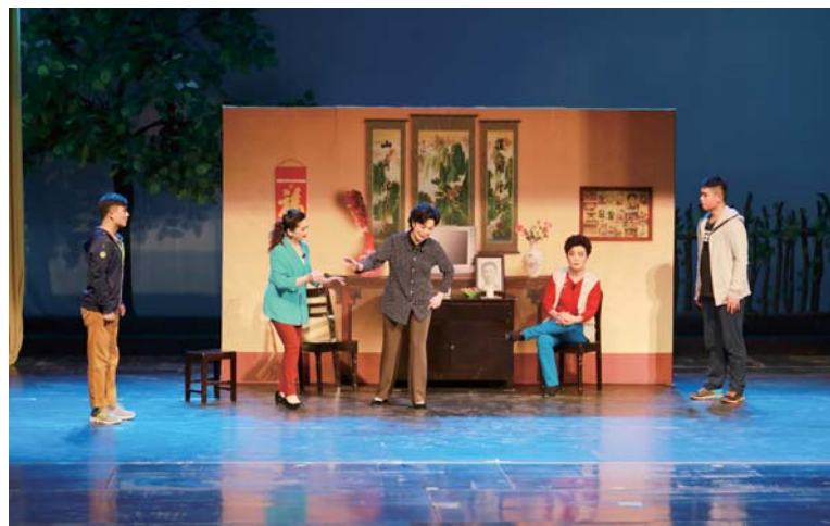
△《新小二黑结婚》演出现场