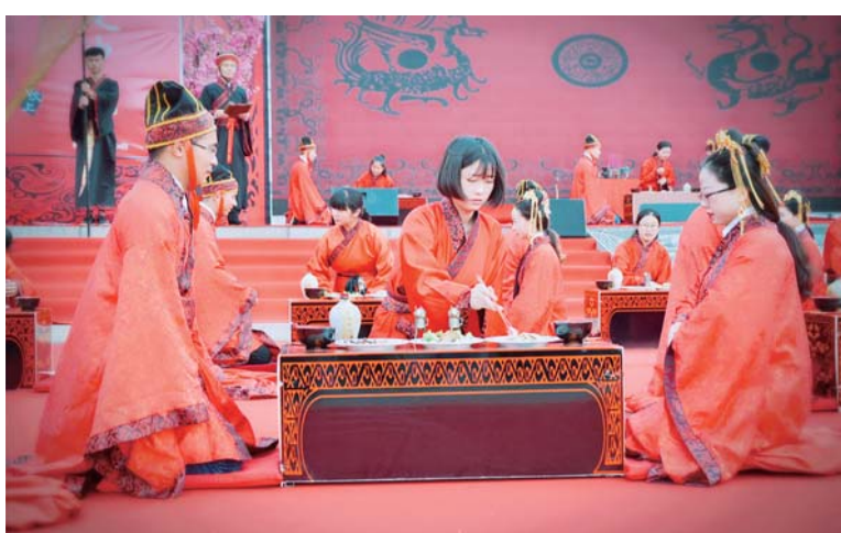
△郭楼镇红色娘子军