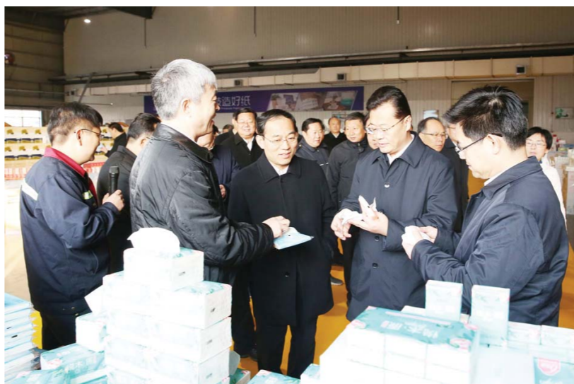
□ 吴新房 吕光社 报道

在《关于加强企业家队伍建设的意见》里，则提出实施企业家素质提升工程，组织选派企业负责人外出研修，鼓励企业经营管理人才在职攻读由市级主管部门组织的MBA项目，取得国家承认的学历和学位后，市财政给予每人2万元的学费补助。同时，抓好青年企业家培养，强化二代接班企业家的培养培训，实行青年企业家培养“导师制”。