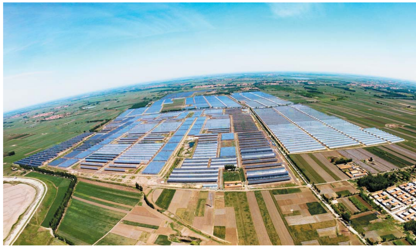
围绕地怎么种，即墨大信镇引入“光伏农业”，一二三产联动，农民不仅获得土地租金，还进棚务工获得工资性收入，收入翻了一番。

“在服务农民方面，山东省供销社系统探索了以土地托管为核心内容的社会化服务模式。通过服务规模化逐步推进农业适度规模经营，从平原地区到丘陵、山区，从粮食等大田作物到经济作物、果树乃至畜禽饲养、房屋、托管的业务内容也从土地作业到畜禽饲养作业。”山东省供销社合作中心主任侯成君说。据介绍，在长期实践探索中，土地托管主要形成了包括以“耕、种、管、收、加、贮、销”一条龙“保姆式”全托管和两项以上服务内容“菜单式”半托管服务两种方式，深受农民欢迎。2014年4月我省被国务院确定为全国供销社综合改革4个试点省份之一，2016年底顺利通过全国供销社总社验收，圆满完成试点任务。经过反复实践探索，我省在平原丘陵地区建设以大田作物托管服务为主的为农服务中心，形成“3公里土地托管服务圈”；在山区建设以林木果等经济作物托管为主的为农服务中心，服务半径约6公里，辐射面积约10万亩，大致形成服务圈。2014年以来，国务院和全国总社先后三次在山东召开现场会推广我省经验做法，土地托管经验目前已推广到全国20多个省份。全省土地托管面积已达2429万亩。山东供销社提出，到2020年建设1500处为农服务中心，实现土地托管服务覆盖全省乡镇全覆盖的目标任务。（□ 赵洪杰）