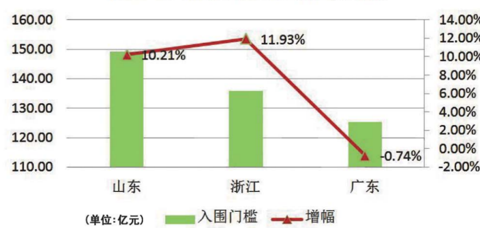
2017年三省百强企业入围门槛对比

规模和数量上不断提高的状况。新旧动能转换,是关系我省发展全局的重大工作,实施新旧动能转换,需要一系列重大项目作为支撑,重点是以“四新”促“四化”,通过新技术、新产业、新业态、新模式,实现产业智慧化、智慧产业化、跨界融合化、品牌高端化。海洋工程装备及高技术船舶是“中国制造2025”确定的十大产业之一。山东省作为海洋经济大省,海洋工程装备业是未来重点培育和发展的新兴产业。此外,以大数据为核心的产业互联网革命已经毫无争议地成为下一个“风口”,未来山东从事软件信息、电子商务、互联网金融、健康养生、文化体育、共享经济等新业态、新模式的企业将有可能爆发性增长。2017年山东企业百强上榜国有企业36家,其中前10名中占6家,国有企业在山东大企业