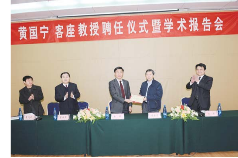
△聘任美国宁教授签字仪式