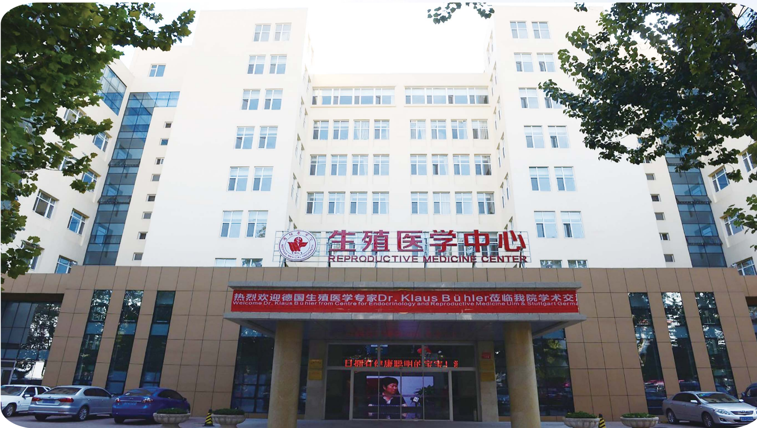
生殖医学中心 REPRODUCTIVE MEDICINE CENTER

几)方面,实行严格的质量控制,从适应症的把握、用药方案的调整、取卵时间的确定到胚胎移植等各个环节都有严格的质量控制标准。中心开展体外授精,单精子卵母细胞浆内显微注射,胚胎辅助孵化技术,胚胎培养及玻璃化冷冻胚胎、冷冻卵子、冷冻精子等技术已经非常成熟而稳定;宫腔镜及腹腔镜诊疗技术已经成为常规技术;复发性流产的病因诊断与治疗已达国内先进水平。 作为公立医院,中心本着最大限度地减轻患者经济负担的原则,让绝大多数(90%)患者通过普通药物及理疗妊娠,在普通药物治疗及物理治疗不孕不育病人妊娠率稳定上升的基础上,不断引进国内外先进医疗设备,提高硬件设施,对难治性不孕病人(10%),采用腹腔镜、宫腔镜手术及宫腔内人工授精、体外授精—胚胎移植技术帮助妊娠,赢得了广大不孕患者的高度认可。 特别是两孩政策放开后,针对患者普遍年龄偏大,手术风险高的状况,中心审时度势,适时调整了人性化诊疗的执行力度,专门配备了心血管专家和大影像专业专家,不断优化诊疗流程,病人满意度不断提升。 随着诊疗质量的不断提升,服务病人的地域分布逐步辐射到河南、山西、辽宁、吉林、黑龙江、新疆等15个省份,以及澳大利亚、新加坡、美国、加拿大等国家,形成了以潍坊为中心呈放射性扩展的格局,生殖中心2016年年门诊量达到214793人次。 2016年中心实施宫腔镜检查及手术4050人次、538例;宫腔内人工授精169个周期;体外授精—胚胎移植临床妊娠率(年龄≤35岁,卵巢功能正常者)高于全国水平。 为了保证在特定资源约束下的成长方向,实现中心长