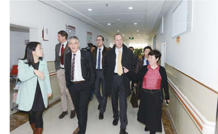
△德国Bahier教授到生殖中心进行学术交流