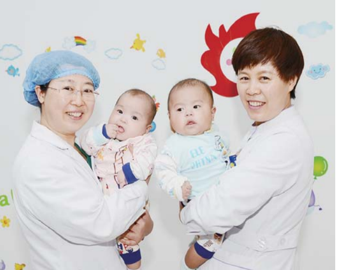
△生殖中心举办宝宝回家活动,免费为试管婴儿宝宝查体

宫腔镜是一种新型微创性妇科诊疗技术,可在不开刀的前提下直视子宫内部,并对宫腔内的病变进行诊疗。按功能可分为检查镜和手术镜两种。宫腔镜检查可对宫腔内的病变进行准确的评估,寻找不孕的病因,也可对某些宫腔内的病变进行治疗。宫腔镜手术主要对程度稍重一些的内宫病变进行治疗,因不需要开刀,所以特别适合不孕症患者。 传统的宫腔镜一般为硬质材料,检查时有明显不适感,且出血明显,有时需要麻醉来解决疼痛问题,增加了检查的风险。