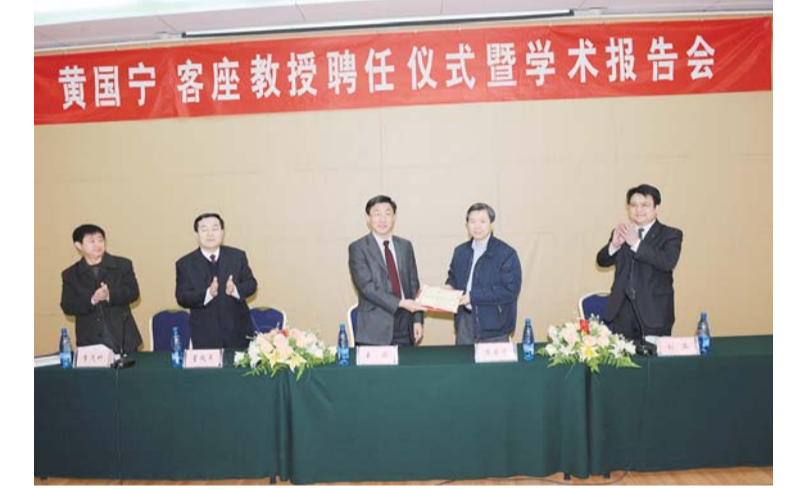
△聘任美国宁教授签字仪式