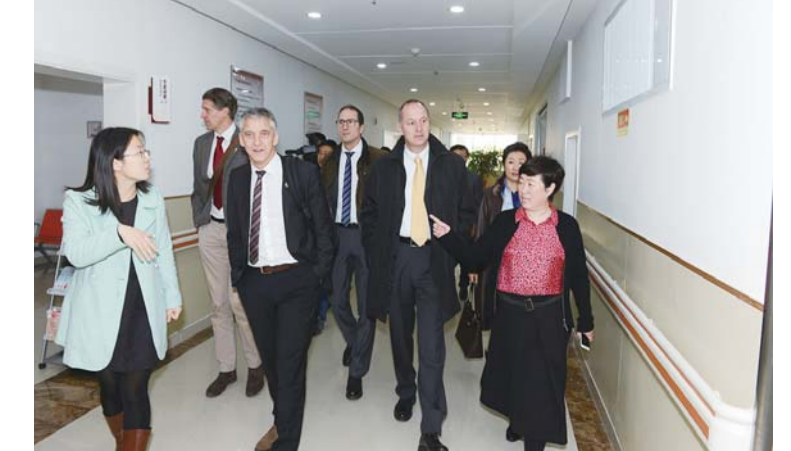
△德国Bahier教授到生殖中心进行学术交流