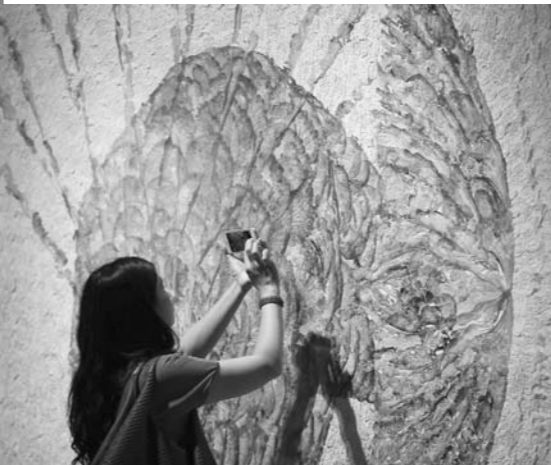
▲游客参观“影舞人生”国家级非物质文化遗产传统皮影精品展。(资料图)