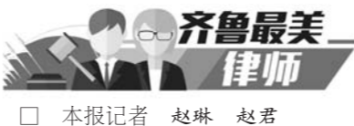
□ 本报记者 赵琳 赵君

近年来，我省广大律师坚持围绕中心、服务大局，主动作为、推进创新，努力为促进全省经济社会发展提供优质高效的法律服务。“齐鲁最美律师”就是他们中的优秀代表。