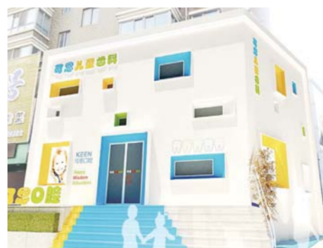
△可恩口腔医院标准化儿童诊疗中心