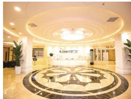
△可恩口腔医院就诊大厅

工程”,倡导的就是“一卡握在手,一生齿无忧”的理念,一次投资,孩子长期享受免费口腔服务。据介绍,可恩口腔健康保障工程推出的蓝盾/金盾卡口腔健康保障可以为孩子解决成长期内的各类牙齿疾病困扰,让孩子健康成长,同时,可以保障孩子成年以后长期的口腔健康,包含种植、矫正、牙齿治疗等项目,让孩子一生牙齿无忧。