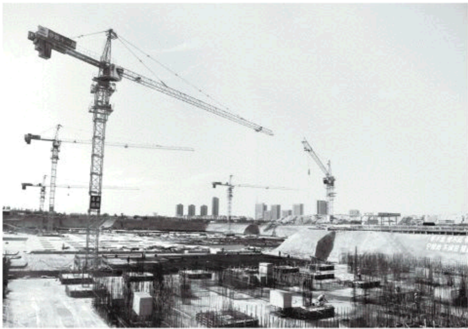
△平度第一三甲医院——青岛市平度中心医院正在加快基础施工

“‘会说会唱’人才是重要资源。平度建立了市镇村‘三级联动’的理论‘说唱’队伍,发掘了2100余名‘说唱’宣讲员。”平度市相关部门负责人介绍。“说唱”讲理论不能昙花一现,更不能老调常谈。其长效机制和创新做法如何实施?平度市委常委、宣传部长刘波表示,平度市发挥志愿者尤其是党员志愿者的作用,及时了解基层“难点问题、热点问题、民生问题”,为“说唱”讲理论积累了一批创作基础素材;聘请了吕剧团、文化馆、戏曲家协会等的专业人员做指导提升;建立和完善了联络员例会制度、宣讲员培训制度及定期调度会等。