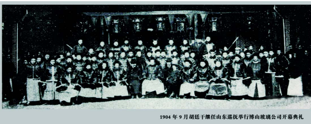
1904年9月胡廷干兼任山东巡抚举行博山玻璃公司开幕典礼

一张普通的股票为什么能入著名收藏家马定祥先生的法眼，又能拍出如此高的价格呢？首先得从这张股票说起。