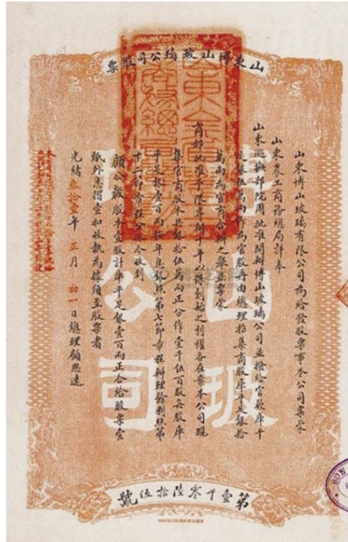
博山玻璃公司股票正本

至于其为何在短短几年时间由盛极一时到宣告破产，早前的分析较多，诸如耗资巨大、资金短缺、炉灶损坏无法修理、经营不善、冗员过多等。张维用认为，这些都不是主要原因，导致博山玻璃公司倒闭的最主要原因，主要来自于社会层面，即帝国主义势力的钳制和压力。他举例说，早在1882年，英国商人伙同买办势力就在上海成立玻璃制造厂。同时，外国玻璃对中国的出口数量也是相当大的，这是他们的利益所在。他们不会真心帮助中国发展自己的玻璃企业，他们在中国掠夺白银，压榨工人，却垄断销路，封锁技术，置中国企业生死于不顾。《山东玻璃工业概况》文中分析其失败原因时，又加上一条：“至于工人方面，大都缺乏知识，墨守旧法，不知研究改良，致所出货物，各家糜不雷同，与外货相较，似有云泥之别。而工业中人，尚以我为之衰落，由于外货充斥之所致，不知外人均从殚精竭虑中