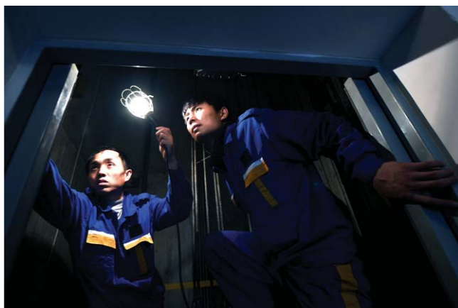
设备上哪怕一个螺丝有松动，就可能影响电梯的正常运行。