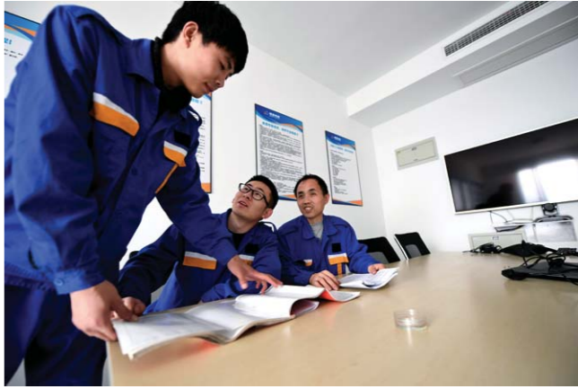
电梯的品牌型号各不相同，精通技术是每个“特工”最看重的事情。