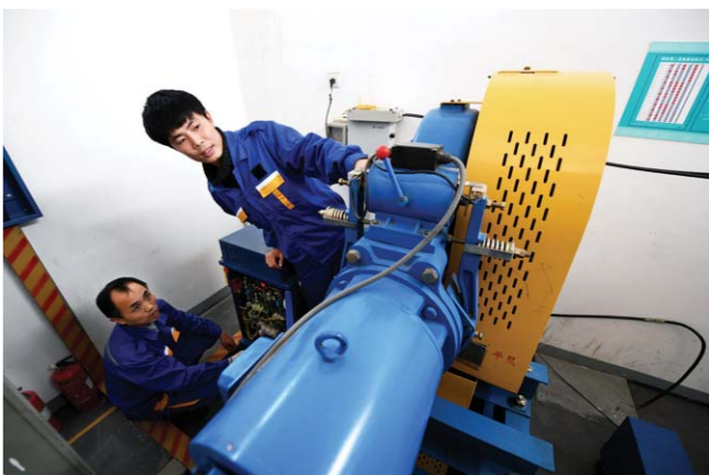
电梯的中枢控制系统在楼顶机房，这是需重点维护的地方。