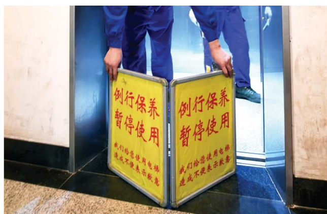
摆放好警示牌，“潜入”电梯井，“特工”们开始了他们的“隐身”行动。