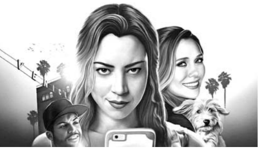
电影《英格丽向西行》海报截图