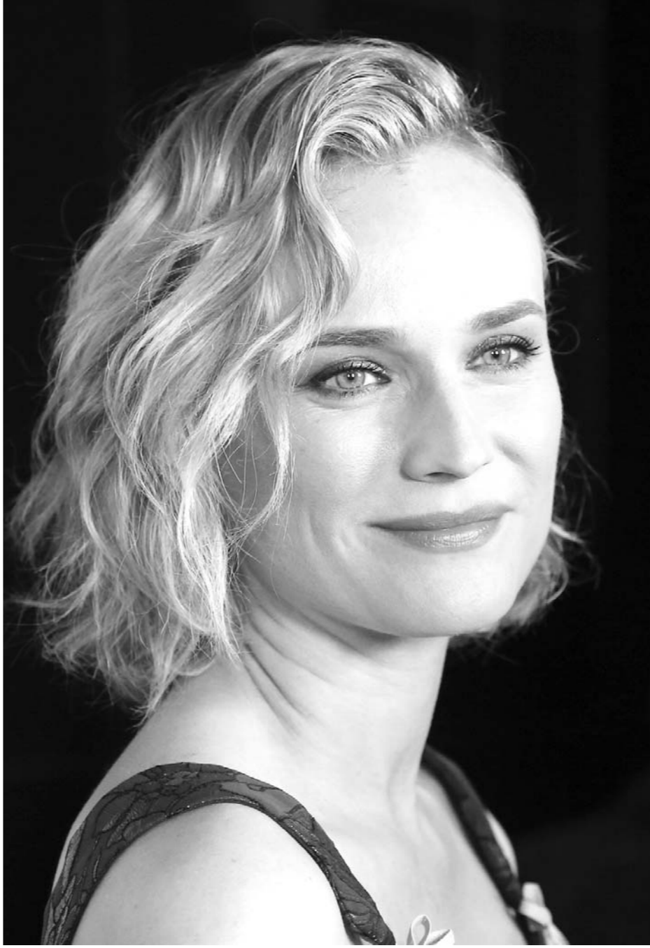
当地时间11月10日,美国好莱坞,2017年美国电影学会电影节制片人发布会举行,德国女星黛安·克鲁格现身。

当造假的一切被拆穿,女主人公吞下了安眠药。“死前”的痛哭,对自我的第一次真实面对,反而成为一夜爆红的“自杀小视频”。梦寐以求的“话题事件”“话题人物”,反而在此刻到来。影片用一种反转的结尾,对着病态的镜像生活砸出最后一块石头。