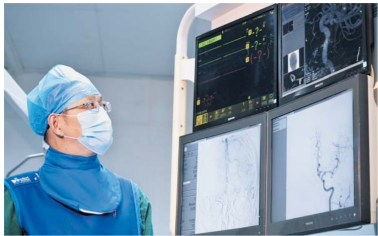
△溶栓绿色通道,屡创生命奇迹

的多个流程与环节,确保病人在最短时间内得到积极救治。“一旦有脑卒中患者抵达急诊,将在医生的推动下迅速进入绿色通道流程。”闫中瑞说,从发病,到上救护车,再到医院,已经用了一些时间,因此,我们努力把来到医院至用药的这段“PNT”时间缩短,尽量控制在60分钟以内。