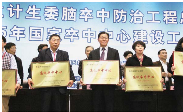
△被国家卫计委脑防委授予“高级卒中中心”称号

为了让患者得到更加及时有效的治疗,2016年8月,济宁市第一人民医院率先开辟脑卒中“绿色通道”,设立专门的卒中急诊,医生24小时值守,优化了卒中患者就诊后需要办理