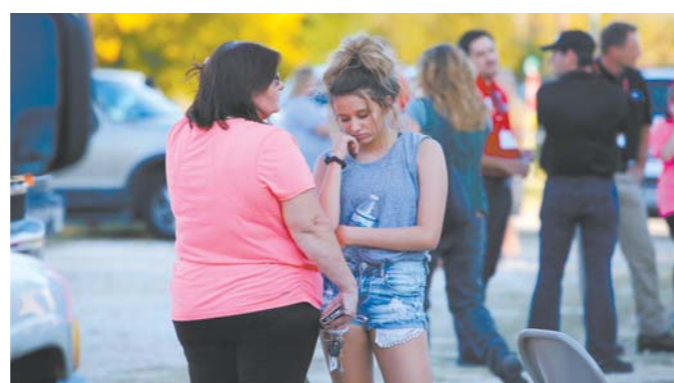
当地时间11月5日，在美国得克萨斯州南部萨瑟兰斯普林斯市发生枪击事件的教堂外，一名母亲安慰自己的女儿。

有人在被送往医院途中身亡。这些死者年龄介于5岁至72岁之间。枪手的身份和动机仍在调查当中，目前只知道他是一名年轻的白人男性，当地警方和联邦调查局等多个部门已经介入调查。