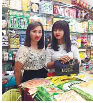
每天数千越南人往返广西打工

沙特阿拉伯10月26日授予美国汉森机器人公司生产的“女性”机器人索菲亚公民身份。作为史上首个获得公民身份的机器人，索菲亚当天在沙特说，她希望用人工智能“帮助人类过上更美好的生活”。