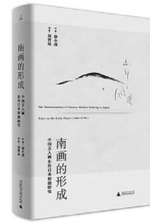
《南画的形成》 徐小虎 著 广西师范大学出版社

作者站在政治治理界探索的前沿，不断思考世界出现的新问题。他的国家理论对于中国学术界以广阔的历史视角与宽泛的比较视角思考中国自身的国家问题一定会有诸多启迪意义。