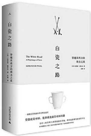
《白瓷之路》 [英] 埃德蒙·德瓦尔 著 广西师范大学出版社

如今司空见惯的瓷器，历史上却是连接中西世界的强大媒介。《白瓷之路：穿越东西方的朝圣之旅》通过瓷器自中国传入欧洲数百年间发展演变的恢弘历史，讲述了独一无二近代中西文明交流的史诗故事。