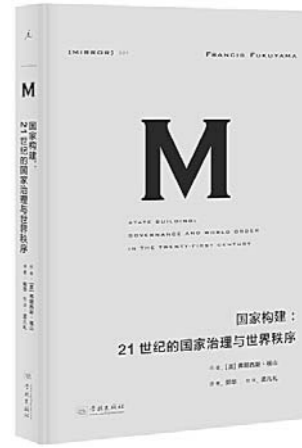
《国家构建》 [美] 弗朗西斯·福山 著 学林出版社

如今司空见惯的瓷器，历史上却是连接中西世界的强大媒介。《白瓷之路：穿越东西方的朝圣之旅》通过瓷器自中国传入欧洲数百年间发展演变的恢弘历史，讲述了独一无二近代中西文明交流的史诗故事。