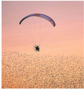
滑翔运动员与八哥翱翔天际

希腊古奥林匹亚遗址，装扮成女祭司的演员们进行2018年韩国平昌冬奥会圣火采集仪式的彩排。2018年平昌冬季奥运会是韩国第一次举办冬季奥林匹克运动会，也是亚洲第三次举办冬奥会。