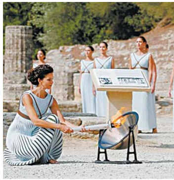
2018年冬奥会前，“女祭司”彩排圣火采集

希腊古奥林匹亚遗址，装扮成女祭司的演员们进行2018年韩国平昌冬奥会圣火采集仪式的彩排。2018年平昌冬季奥运会是韩国第一次举办冬季奥林匹克运动会，也是亚洲第三次举办冬奥会。