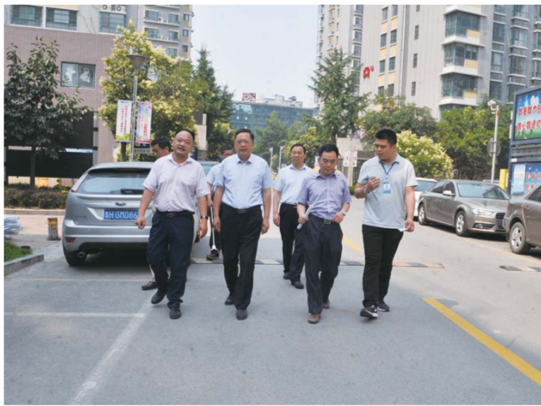
△学院领导深入包保网格一线,并邀请市创城办专家指导工作

通过广泛宣传,不仅学院广大师生文明素养进一步提升,责任区内市民的创城意识也进一步提升,支持创城、参与创城、为创城作贡献的热情得到广泛激发。