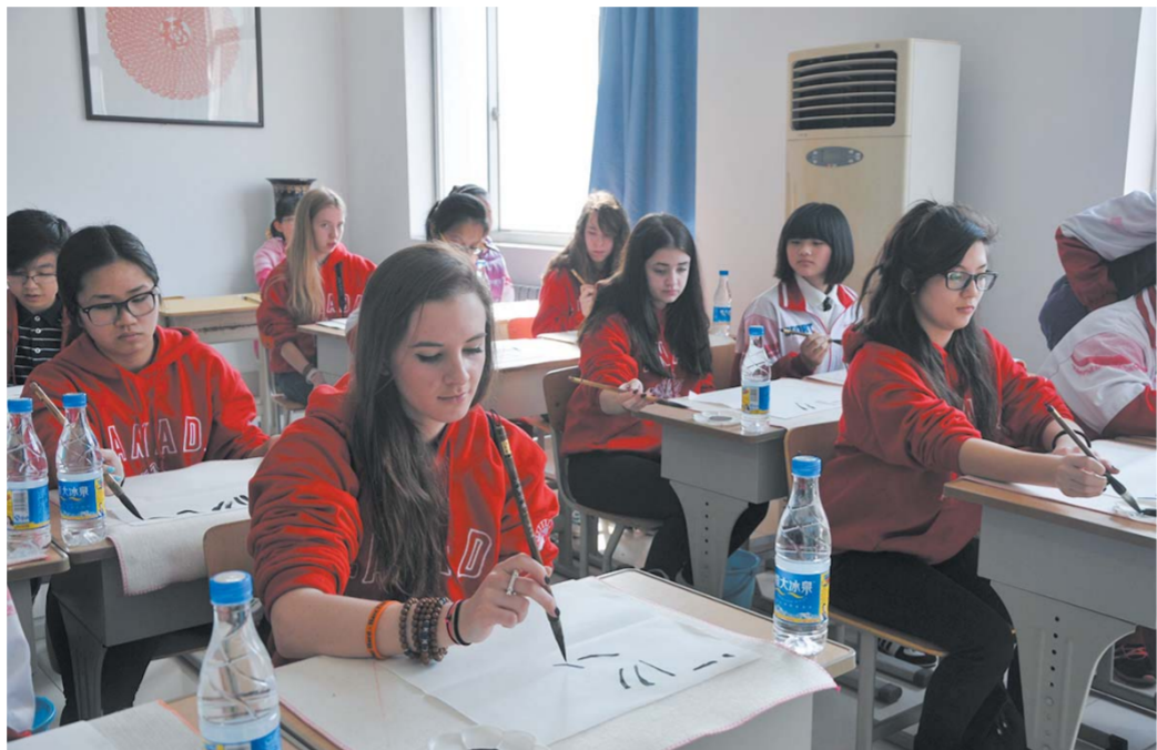
△国外初中生在附中体验书法课

校园文化是一所学校的根基,未来学校的竞争将是学校文化内涵发展的竞争。从经典诵读的琅琅读书声,到关于传统文化的校本课程;从每年9月时各个社团纳新的火热景象,到穿过大洋彼岸的游学体验;属于济宁学院附属中学的特色文化正在点滴中积水成渊。教育不是注满一桶水,而是点燃一把火。济宁学院附属中学以特色课程、精品社团和主题教育活动为切入点,已经成为山东省篮球传统项目学校、全国足球特色学校,对外国际交流学习也已形成办学特色,进一步丰富了学校办学内涵,全面提升了学校办学品质。六十五载砥砺前行,经过一代代人的努力奋斗,济宁学院附属中学已经形成了底蕴丰厚、内涵丰富、形式丰茂的“附中文化”,这是学校实现创新发展、科学发展、和谐发展的原动力。