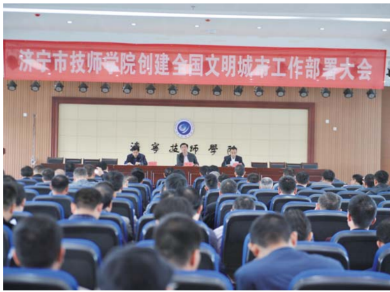
△2017年4月18日,学院召开创建全国文明城市部署大会

“我院负责第34网格片区东至沔河河中间、西至火炬路、南至沔河路、北至吴泰闸路,负责的‘路长制’路段为吴泰闸路东至沔河河、西至英萃路路口。整个网格属东部进出市主城区的‘桥头’关键位置,辖区内沿街商户共计204家、单位45家、住宅小区4个,商户密集、居住人口密度大、人流量大、车辆多、基础设施薄弱,创城工作难度较大。学院将包保网格及‘路长制’包保路段进一步细化为16