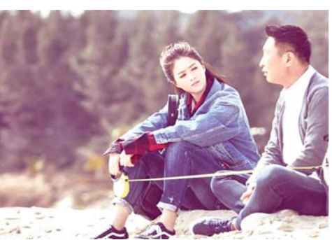
电视剧《凡人的品格》剧照