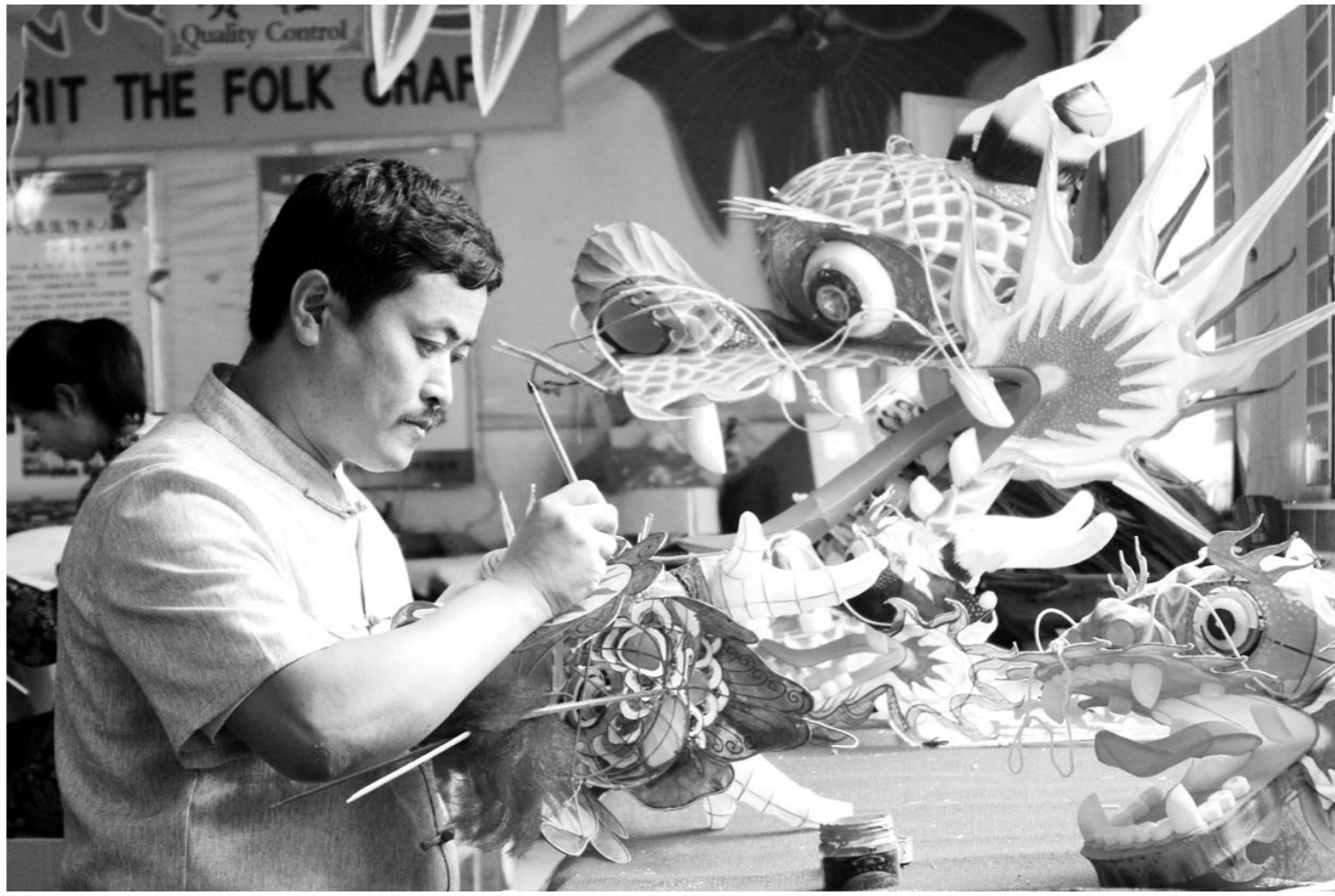
寒亭杨家埠的风筝艺人，正在扎制风筝。

在打造新项目的同时，寒亭同样注重原有文化企业的扶持培育。天成飞鸢、丰泰文化、盛壮红木、木版年画社等骨干文化企业，都在自己的市场领域形成了独特竞争力，并为文化名市建设输送了大批文化人才。 文化产业“百花齐放”，寒亭逐步形成“一心辐射、两带贯通、九大基地支撑”的文化产业发展格局。“一心”就是以杨家埠为龙头的民俗文化创意中心；“两带”即白浪河和浞河两条休闲娱乐带；“九基地”即风筝年画创意产业基地、广告创意产业基地、工业设计总部基地、文化交流