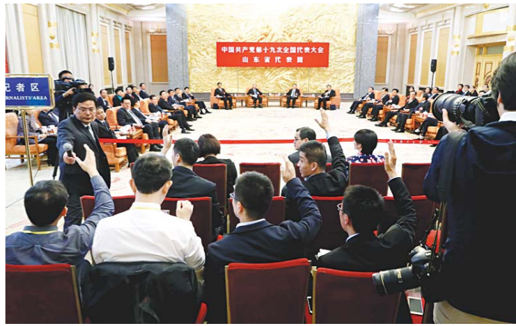
记者们踊跃举手提问。