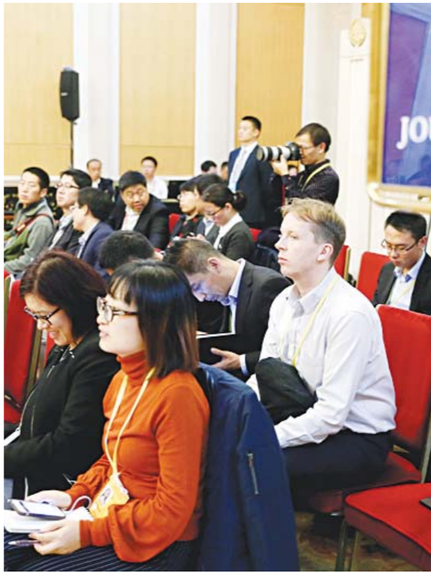
境内外45家媒体61名记者旁听了山东代表团讨论十九大报告。