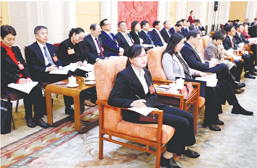
代表们在认真听取讨论发言。