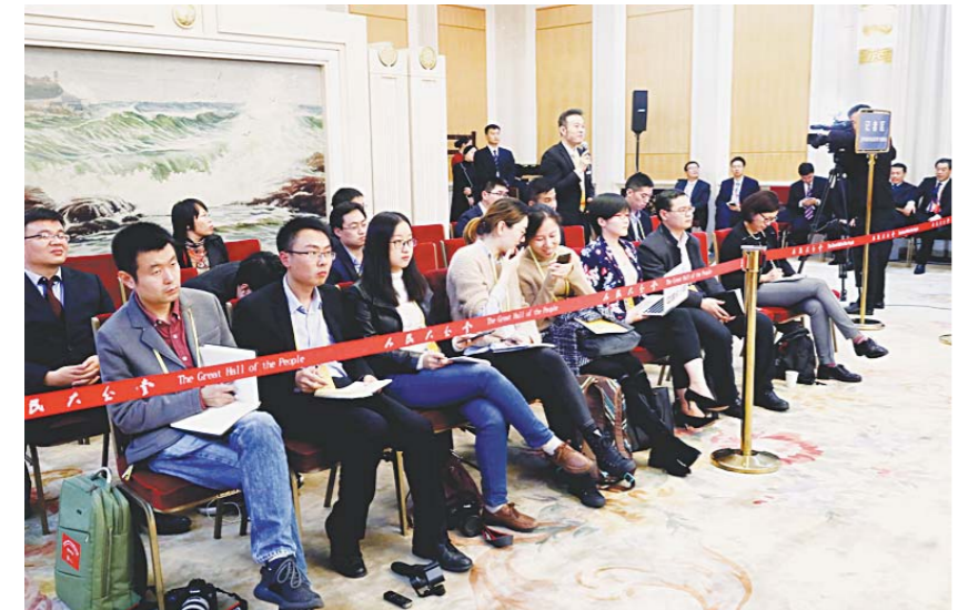
来自中央电视台等中外媒体的记者们所提问题，充分反映了世界对我省发展的关注。