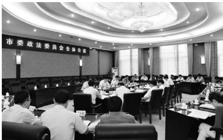
△聊城市委政法委全委会召开，研究部署全市政法综治工作

为了提升基层政法干警的政治素质和业务能力，聊城市委政法委常态化举办全市政法综治专职干部专题培训，对135个乡镇、115个市直部门政法综治干部进行业务培训，与聊城市委组织部紧密联合，定期对政法部门领导班子成员和优秀年轻后备干部进行考核，及时调整和配备政法部门领导班子，确保政法队伍的领导力掌握在党委手中。市委政法委与市纪委、市直机关工委联合，定期指导政法部门内部党组织开展活动。组织政法部门党组织和党