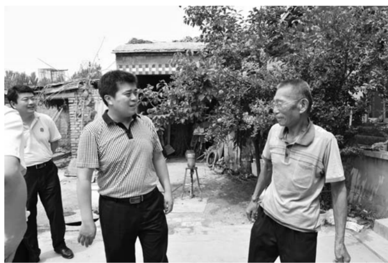
△聊城市委政法委扎实开展精准扶贫、双联共建工作

联网共享、综合应用做出了详尽指导方案。目前，聊城市监控探头保有量达14.3万个，重点部位、重点区域和村庄(社区)覆盖率达100%，全面完成视频监控全覆盖建设任务。“大平安”“大防控”体系初步建成。仅2016年，聊城市委政法委先后召开全市范围的维稳反恐工作会议4次，对开展严打整治斗争进行安排部署，全市共破获刑事案件3740起，刑拘1620人，逮捕688人。在日常工作中，聊城市委政法委坚持综治牵头协调、公安具体实施，滚动治理公共安全隐患，开展公共场所集中清查行动4次，抓获违法犯罪嫌疑人64人；集中开展危爆物品寄递物流清理整顿，检查企业327家，约谈企业46家，停产整顿2家，确保了全市公共安全形势持续平稳。