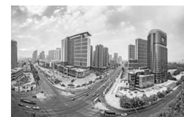
△即墨特色精品城市建设日新月异

从净美畅亮的城区主干道，到整洁有序的街巷道路；从现代大气的滨海公园，到清新别致的魅力村庄……今年以来，即墨以品质即墨、宜居即墨建设为引领，认真落实创新、协调、绿色、开放、共享的发展理念，站在青岛现代新区目标定位，着力推进城乡环境综合整治，努力建设特色鲜明宜居幸福的现代化新城，不断提升环境舒适度、城市美誉度和市民满意度。