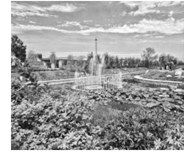
△即墨姜戈庄村美丽乡村绿化建设一景