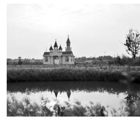
△经过治理，羊毛沟从一片盐碱地变成了花海湿地生态产业园，成了乡村旅游的目的地

今年以来，青岛市城阳区以“阳光城阳”建设为指导，计划总投资7.36亿元，实施114个城乡环境综合整治项目，通过开展老旧楼院及背街小巷、环境卫生、美丽宜居乡村环境、生态景观、城区道路景观、便民市场及周边秩序等六大领域综合整治行动，借势城市“双修”，以人民为中心，以创新为引领，以统筹为主线，精心设计、精致建设、精细管理、精准整治、精诚服务，着力解决城乡环境突出问题，改善广大群众生活环境，提升城乡内涵品质，把整治提升要求“落细落小落地落实”，彰显洁净有序城阳特色，加快建设生态宜居、品质活力的胶州湾北岸中心城区，让人民群众有更多更好的获得感和幸福感。