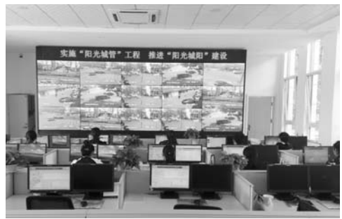
△城阳区借助“数字城管”监督管理平台，依托物联网技术与移动互联网技术，建设起全区“智慧环卫”管理系统，对街道环卫实施实时动态化监管

城阳制定了以专项整治考核、工作任务量、综合考核、督查落实四个方面为主要内容的考核办法，纳入全区综合考核体系。制定了《城乡环境综合整治工作方案》《物业管理联席会议制度》等一系列制度，城区和六个街道均建立了精准化网格管理制度，构筑了各负其责、属地为主的物业管理组织架构。开展了全区物业行业“文明服务年”创建活动，180个