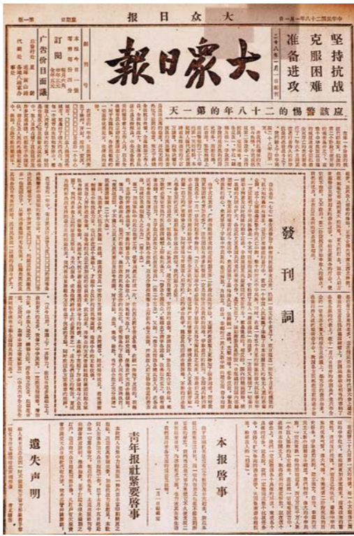
1939年1月1日，大众日报在沂水创刊。上图为创刊号。(资料图)