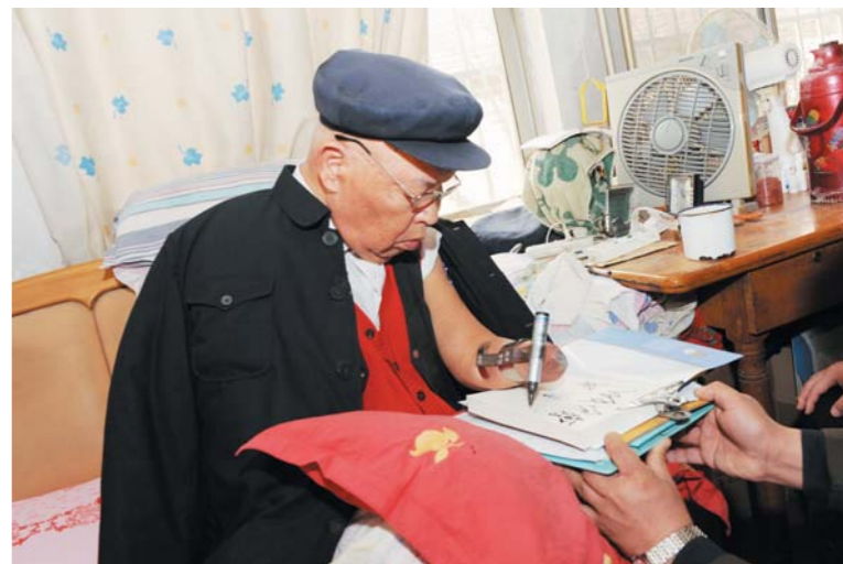
2015年1月21日，“时代楷模”朱彦夫在家中写字。朱彦夫的事迹是沂蒙精神在当代的具体体现和鲜活传承。