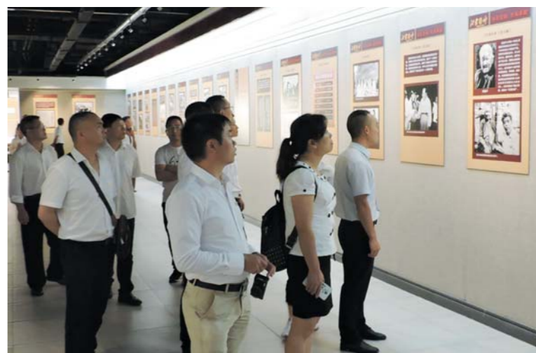
2017年6月15日，《水乳交融，生死与共——沂蒙精神图片展》在浙江嘉兴南湖革命纪念馆展出。