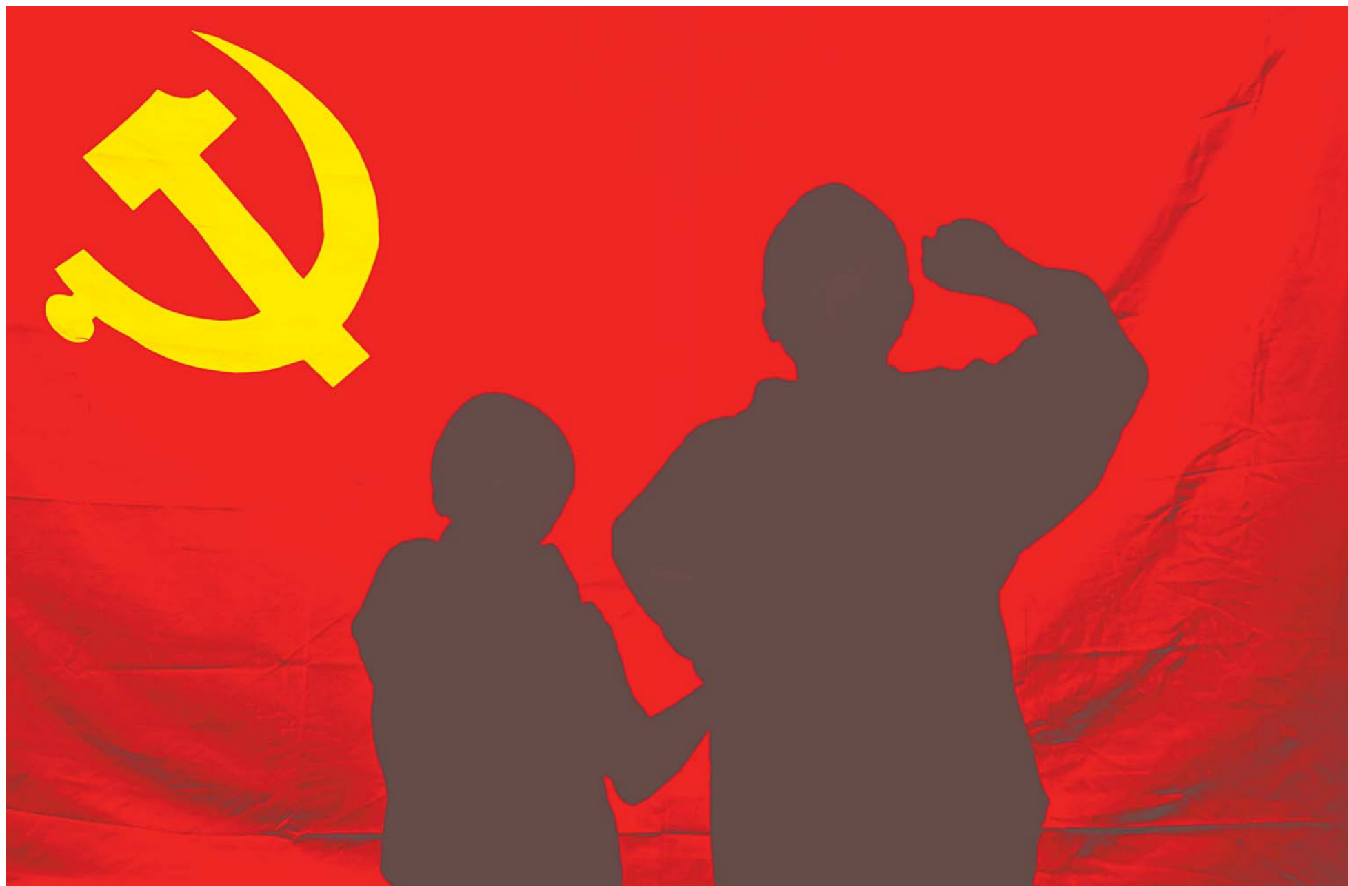
2016年8月24日，在临沂市郯城县港上镇港上社区党支部，共产党员宋保印(右)带着孤儿小天贻在党旗前宣誓，让他收养的这个孩子一起体验作为党员的光荣与神圣。

◆沂蒙精神不是地域性的概念，而是具有标志性、引领性的灯塔和旗帜，是党的革命传统精神，更是全体山东人民的宝贵精神财富，是在新的历史起点上攻坚克难、砥砺奋进的强大精神力量。 ◆面对新的历史使命，更需要全省党员干部群众肩负起时代赋予的光荣使命，凝聚起攻坚克难的强大合力，创造无愧于党、无愧于人民、无愧于时代的业绩，这才是对革命先烈、对山东人民最好的回报，也是对沂蒙精神最好的弘扬。