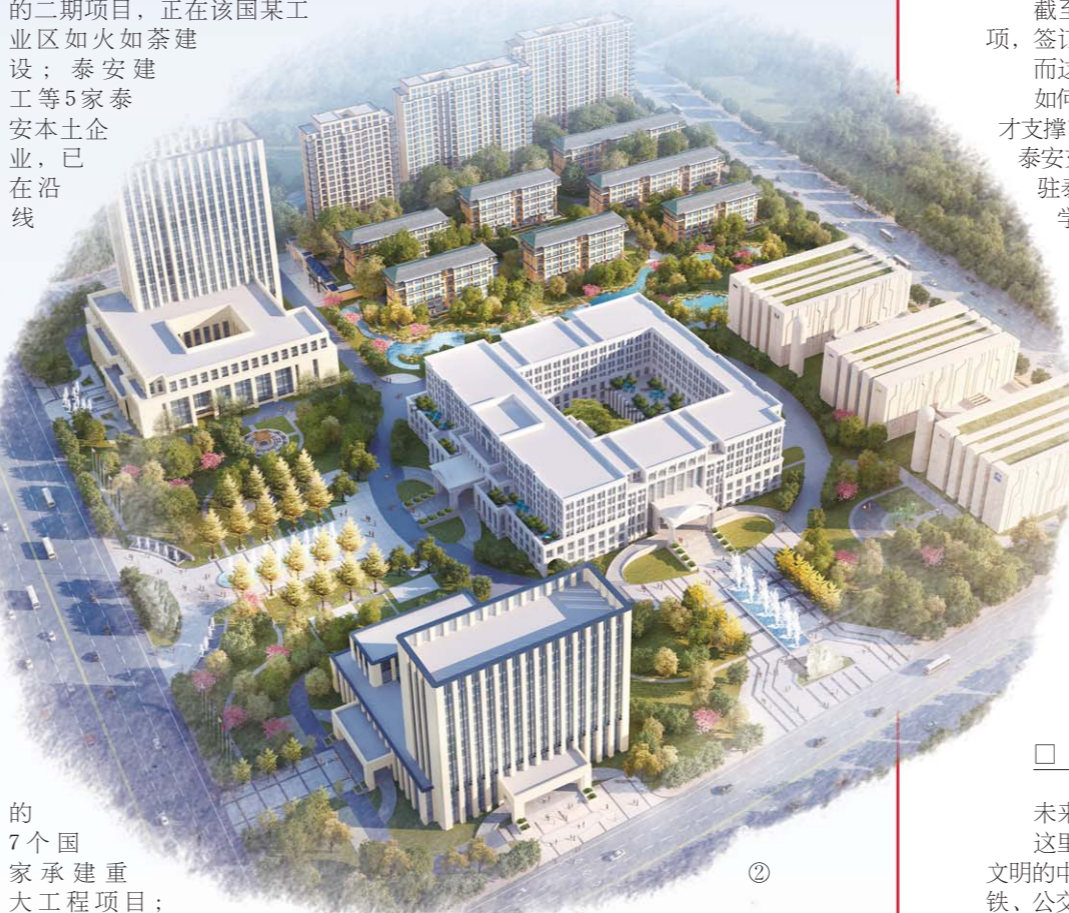
的7个国家承建重大工程项目；大量技术型劳务人员源源不断派向沿线国家……

今年1—8月份，泰安市实现进出口总值100.8亿元人民币，较去年同期增长15.4%，增幅较2016年同期扩大16.8个百分点。