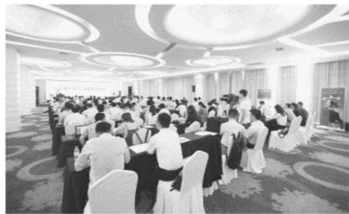
△“山东福利彩票30年发展论坛”在济南举行

福利彩票30年》画册和《山东福利彩票30年产品图录》，全面展现了山东福利彩票30年的发展历程，展示了中国福利彩票的票种产品在山东发行销售的成长和演变，画册和图录在论坛上首发。