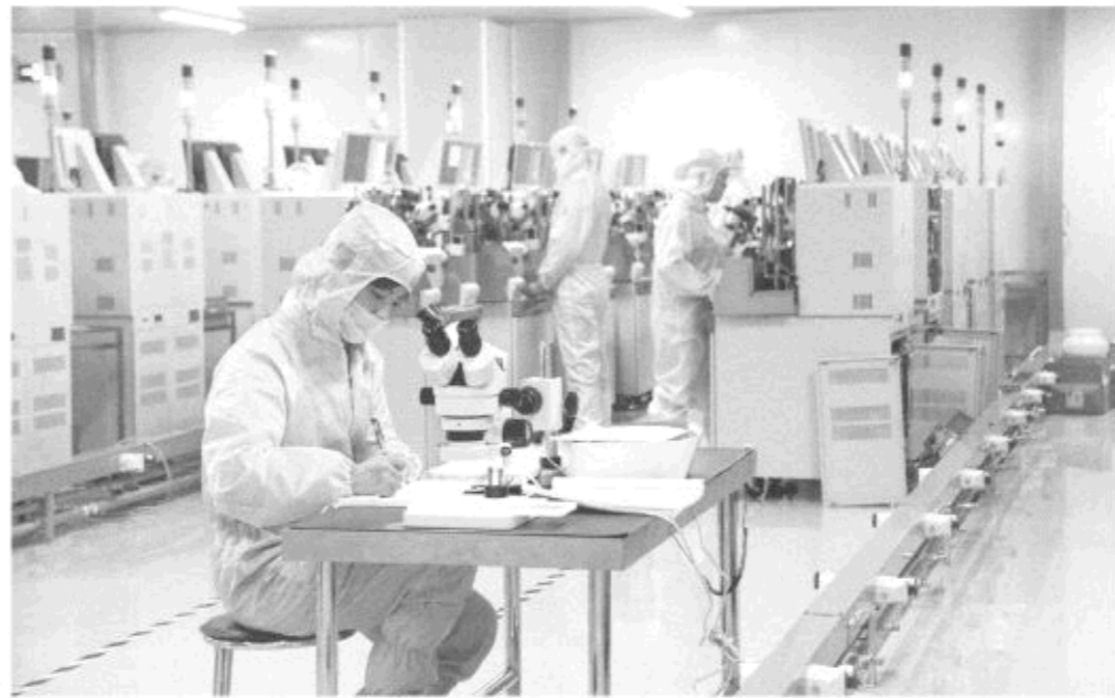
△汉旗科技项目创民族品牌

丰源集团是峰城区的区直骨干企业,由于建设早,工艺相对落后,产品成本高,近两年,企业生产经营一度陷入困境。如何引导传统产业优化升级,打造新引擎、激活新动能?