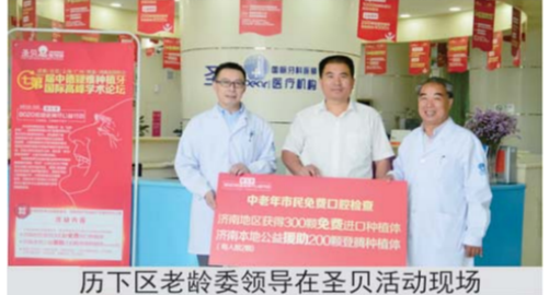
历下区老龄委领导在圣贝活动现场

国)正畸中心、德国弗莱堡大学Strub口腔联盟医院(中国)美齿研究中心相继落户圣贝牙科。双方曾先后举办过多届中德种植牙技术国际高峰论坛,来自全球数百名种植牙权威专家齐聚圣贝,成为中国种植牙领域的年度盛事。