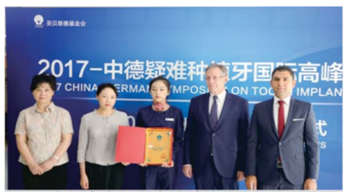
中外专家组在中德种植峰会现场

圣贝国际牙科作为德国弗莱堡大学Strub口腔联盟医院,双方在医、教、研、培领域有广泛合作。自2013年以来,圣贝国际牙科便成为“德国弗莱堡大学Strub口腔联盟医院中国培训基地——牙种植中国教学基地”。2014年1月,圣贝牙科凭借高科技的种植牙尖端技术,成为亚太杰出委员会认定的中国高端牙科品牌,荣膺“亚太杰出——TOP Brand大奖”。同时,德国弗莱堡大学Strub口腔联盟医院(中国)种植牙中心、德国弗莱堡大学Strub口腔联盟医院(中