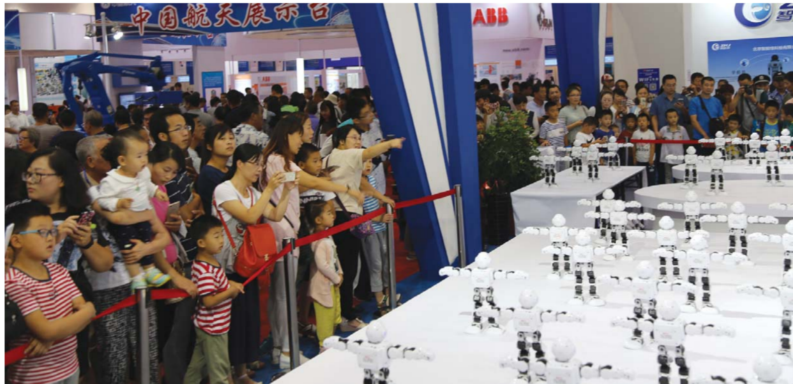
△机器人表演赛让参会观众赏心悦目

快新旧动能转换的重要平台。对比中日韩产业博览会举办前后可以清晰地发现,潍坊的“国际范”“活力范”更足了。