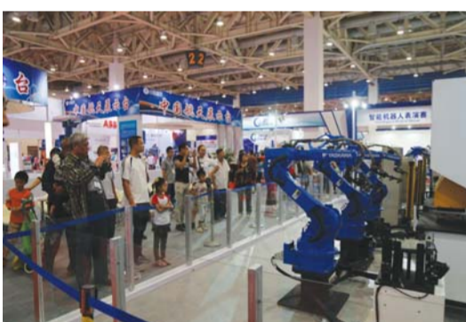
△参会观众在欣赏参展企业的机器人

比如,在本次中日韩博览会现场,市民可以看到唱得了歌、跳得了舞、聊得了天、干得了家事的机器人,为人们展示智能时代的美好前景;可以看到国机集团带来的4款不同负重、不同功能,可以自由编程、自动化作业的工业关节机器人;还将有机会与刚刚受邀参与香港回归祖国20周年创新科技成果展的“网红机器人”——荷福羽毛球机器人一较高下。荷福羽毛球机器人能够对快速移动的羽毛球精准定位,并快速处理信息,在1秒种内作出挥拍反应。届时现场观众可有机