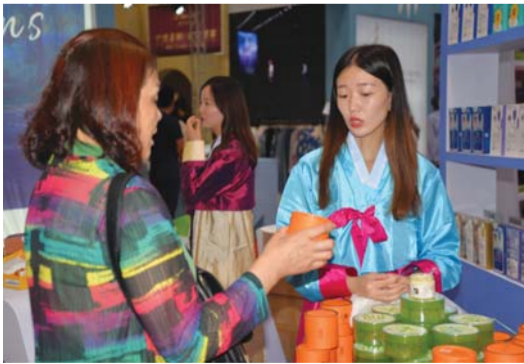
△化妆品成为众多参会观众选购的产品