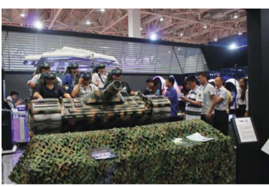
△参会观众排队体验VR