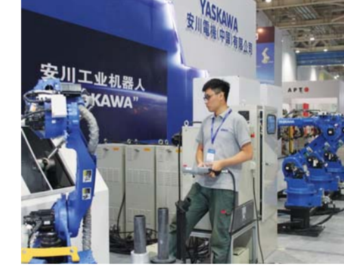
△日韩等国家企业踊跃参展。图为2016中日韩产业博览会上,参展人员调试机器人

众所周知,中日韩产业博览会是一个务实的经贸交流平台。博览会作为一个综合平台,看点亮点多,可以说异彩纷呈。重点在于探讨产业合作,开展投资贸易洽谈,最终落脚点是招商引资和扩大对外贸易。为此,其间,还将举办中日韩企业对接洽谈会等产业对接活动,“一对一”企业对接会、重点项目签约仪式等系列配套活动。突出现场交易、贸易配对、投资促进、企业服务、成果展示等,旨在实现以会促展和良性互动。