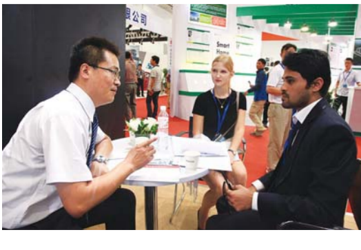
△在中日韩产业博览会上,来自国外的客商正在进行经贸洽谈