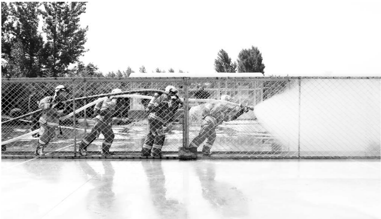
□姜言明 刘涛 王锦波 报道

道路拥挤、私搭乱建，往往是人们对一些城市老旧小区的印象。记者走访了济南几个居民小区后发现，有物业管理的小区消防通道比较畅通，但部分开放式老旧小区情况堪忧。长盛小区是济南市较大的老旧小区，机动车都停放在楼与楼之间的空地，使本就很狭窄的道路更加拥挤，加上一些营业场所占用公共道路，救援车辆能否顺利进入成了大问题。今年，济南开出首例堵塞消防通道阻碍救火的罚单。济南市历城区某小区住宅发生火灾，两辆私家车堵住了消防通道，导致延误10分钟救援时间。依照《消防法》，民警对两名涉嫌堵塞消防通道的违法者分别处以500元罚款。