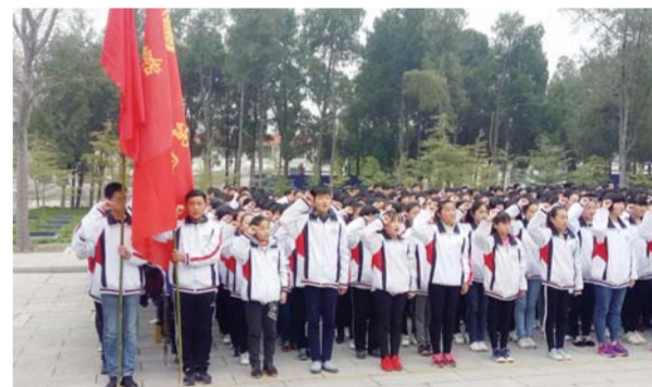
△缅怀革命先烈，发奋学习报国