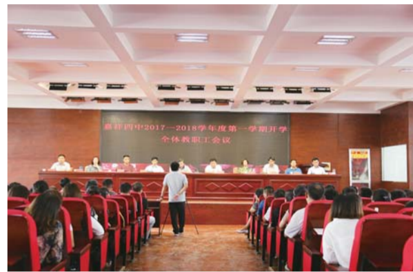
△师德师风建设培训