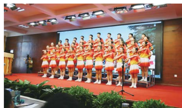
△社会主义核心价值观组歌传唱