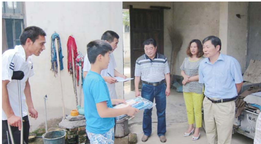
△校领导走访贫困生