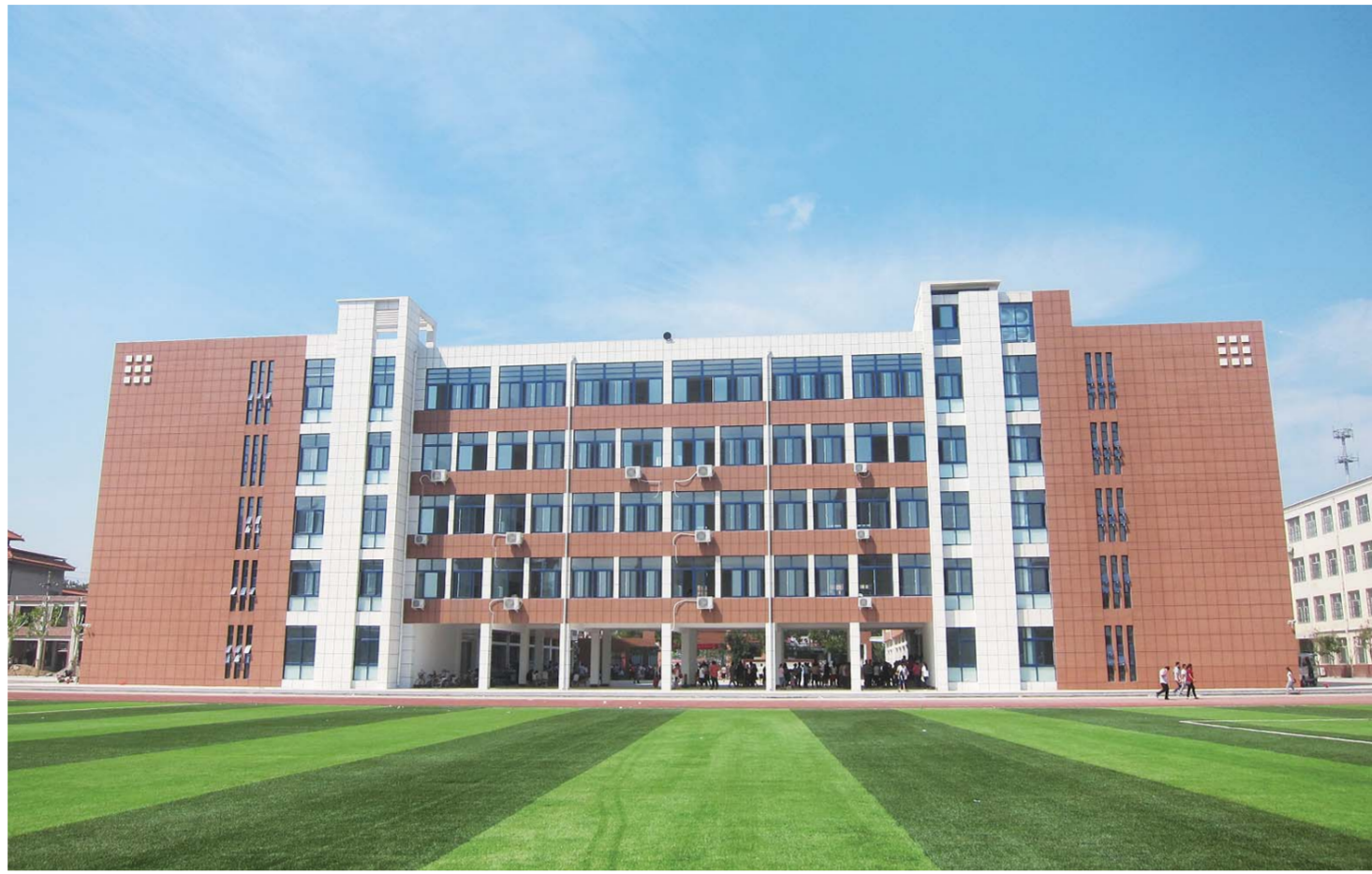
△2017年启用的教学综合楼

为加强师德师风教育，学校始终坚持熔铸育人的指导思想，以“敬业、爱生、奉献”为主题，着力打造师魂。学校完善了教师师德考核评价条例，督促教师不断提高自己的思想政治素质；每年组织教师进行暑期师德师风专题培训，提高其对德育工作重要意义的认识；开展学习师德师风典型活动，让老师们感受榜样的力量，弘扬正能量，树立师表新形象；开展师德师风“讲评赛”活动，增强教师光荣感、神圣感、责任感；开展“我出彩、铸师魂”文艺演出、参加“四德歌”健身广场舞大赛、组建教师合唱团、开展教职工篮球赛和跳绳比赛等丰富多彩、形式多样的德育教育活动，让老师们在氛围中接受