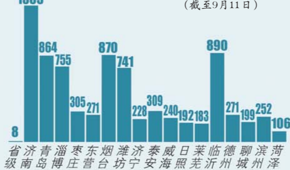
数据:王亚楠 制图:巩晓蕾