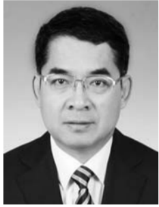
杜建华 安丘市委副书记、市长

领导干部“安全生产月”等制度，每年组织开展“安全生产百日集中行动”，对安全生产逢会必提、有患必查，做到思想重视、隐患整治、宣传培训、应急演练“四个常态化”。 二是标准化。标准化是提升本质安全水平的治本之策，必须紧紧抓住这个“牛鼻子”。安丘市坚持政府主导、专家指导、企业主体，大力推进安全生产标准化建设，抓基层、打基础、苦练基本功。全市60.4%的规模以上工业企业完成安全生产标准化建设。 三是专业化。安全生产政策性、专业性、敏感性强，必须以专业化保证工作的实效性。安丘市建立了包含23名专家的安全生产专家库，并聘请专业中介组织专家参与隐患排查整治。去年以来，借助专业力量排查整治安全隐患2.6万个。 四是法治化。法律法规是安全生产的准绳，必须用法治思维和法治手段解决安全生产问题。安丘市依法建立了“网格化、实名制”监管体系，依法严厉打击各类违法违规生产经营行为。去年以来，立案查处安全生产违法案件720起，关闭非法违法企业126家，形成了强大震慑。