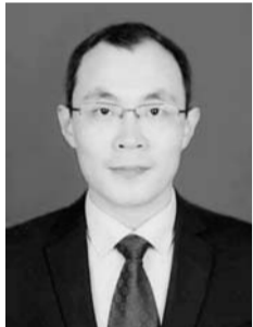
田晨光 沂源县委副书记、县长

责；夯实村级安全监管责任，在全县641个村居(社区)配备专兼职网格员641名，及时上报反映基层安监动态。全县形成了县镇村三级齐抓共管的责任机制。 二是严格隐患排查。坚持做到安全隐患有查必改，将隐患彻底整改到位。扎实开展各级巡查督查整改“回头看”活动，对发现的850条隐患问题整改情况逐一核实，目前，已整改819条，其余31条正在限期整改。深入开展“大快严”集中行动和重点领域安全生产专项整治行动，检查企业3771家次，发现隐患11583条，目前，已全部整改到位，消除了潜在的安全隐患问题。 三是严格执法检查。加大安全执法检查培训力度，定期举办全县安全生产行政执法培训班，聘请市级专家讲解安全生产执法文书、涉爆粉尘工贸企业执法检查、行政执法现场证据采集等知识。坚持以“三铁”态度，深入开展全民执法，重点检查危化品、道路交通、消防、建筑施工、涉氨冷库等行业领域，严肃查处各类安全生产非法、违法行为10921起，今年以来实施行政处罚67起、罚款金额50.77万元。 下一步，我们将进一步压实责任，具化措施，加强“两个体系”建设和村居网格化管理，大力开展隐患排查治理，确保全县安全生产形势持续稳定。