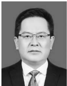
赵居安 济南市长清区委副书记、区长

强化组织保障，贯彻落实“党政同责、一岗双责”制度。健全完善领导机构，加强督促调工作，充分发挥安委会成员包街镇督查组的作用，定期到所包街镇和企业进行督导检查，及时发现并着力指导解决问题。加大目标考核力度。按照“四不放过”要求，对因组织不力、监管把关不严、防范措施不到位等导致事故发生的，依法追究有关单位及相关负责人的责任，用事故教训更好地推动安全生产工作。 强化企业主体责任，贯彻落实“生产经营单位是安全生产的责任主体”制度。企业法定代表人是安全生产第一责任人，必须对本单位的安全生产全面负责，确保安全生产“五落实、五到位”。创建安全生产标准化，全面推进安全生产隐患排查和风险分级管控双重体系建设。推进企业建立安全诚信机制，不断提高企业自身安全生产管理水平，有效减少安全事故发生。 按照属地管理和部门职责，贯彻落实“管行业必须管安全、管业务必须管安全、管生产经营必须管安全”原则，强化道路交通、消防、建筑施工、非煤矿山、危险化学品、特种设备等领域安全生产工作。