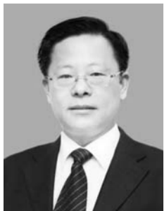
李红兵 青岛市城阳区副书记、区长

在心、安全发展重任勇扛在肩、安全监管举措紧抓在手，以“阳光城阳”建设为统领，从高处看、从深处想、从实处干，不断夯实安全生产基层基础，全面提升安全生产工作水平，为建设生态宜居、品质活力的胶州湾北岸中心城区创造良好的安全环境。 坚持从高处看，牢固树立新发展理念，做到人民利益至上，始终把安全生产与经济社会发展工作同部署、同推进，以新格局、新视野引领安全。 坚持从深处想，以推进安全生产领域改革发展为主线，不断推动制度创新、体制创新、技术创新和文化创新，全面构建“阳光安全”体系，以新理念、新机制保障安全。 坚持从实处干，坚守发展决不能以牺牲安全为代价这条不可逾越的红线，按照“落细、落小、落地、落实”的要求，强势组织领导，强力排查隐患，强制整改整治，强化刚性约束，以新手段、新举措狠抓安全。 安全生产工作离不开广大企业的理解与参与，更离不开社会各界的关心和支持。让我们携手并肩，群策群力，共营安全环境，共创美好明天，加快建设宜居幸福创新型国际城市！