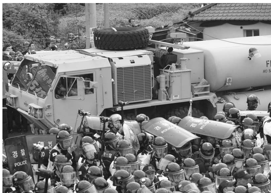
6日深夜起，数百名当地民众及和平人士聚集在“萨德”部署地附近的星州郡郡成里，彻夜阻拦“萨德”装备进入。