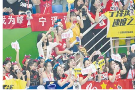
►9月4日，在粉丝的尖叫声中，河南队选手宁泽涛以47秒92的成绩夺得男子100米自由泳冠军。 ▲▼粉丝的助威设备各式各样，整个游泳馆就像大型演唱会现场。

往游泳馆，在五点前就会开始一天的训练。 远离国内复杂的舆论氛围，远离一个又一个的商业广告，宁泽涛过得更加单纯。除了训练之外，宁泽涛每天都和家人一起买菜做饭，生活过得很充实，就像他自己说的，“全新的生活，不一样的体验。”这样轻松的生活，也帮助宁泽涛很快找回了状态。在国家队征战世锦赛之时，宁泽涛在澳大利亚当地的比赛中，游出了46秒64的个人最好成绩。 天津全运会，是宁泽涛复出之后的第一次大赛，也是他重回巅峰的开始。47秒92，虽然与他个人的最好成绩还有一些差距，但已经是他自从2015年喀山世锦赛之后的最佳成绩，比四年前全运会夺冠的成绩快了0.35秒。 “目前专注于比赛，还没想以后的事情。”谈到未来的打算，宁泽涛没有正面回答。 (本报天津9月4日电)