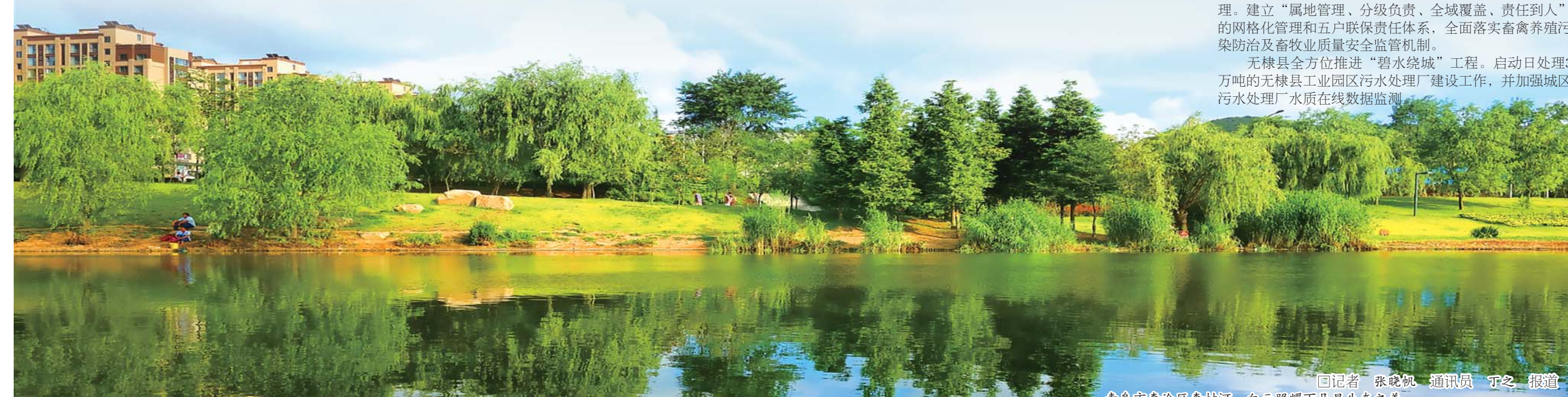
□记者 张晓帆 通讯员 于之 报道 青岛市李沧区李村河,白云照耀下凸显生态之美。