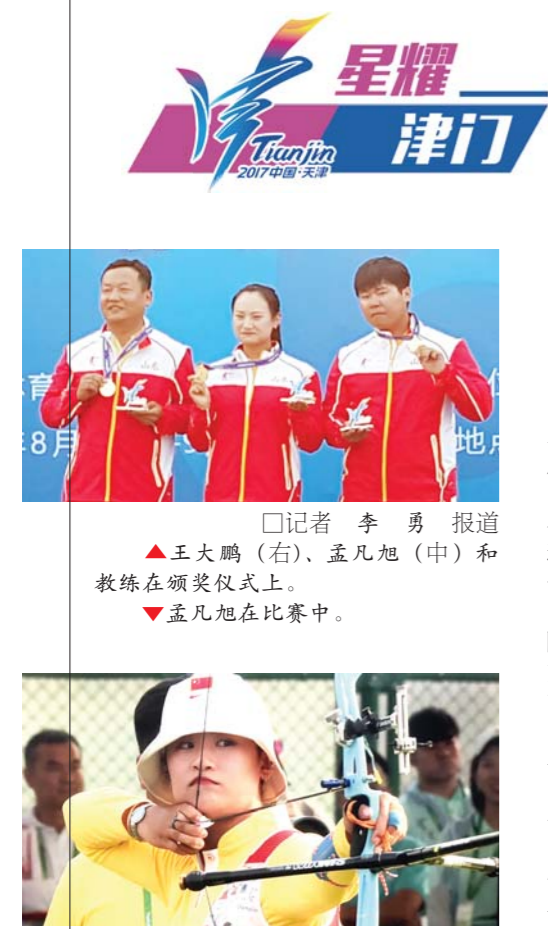
□记者 李勇 报道