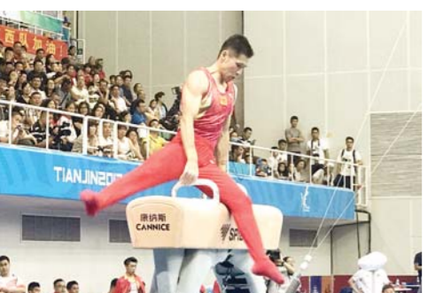
□记者 王磊 报道