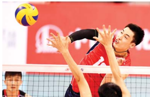
□ 记者 李勇 报道