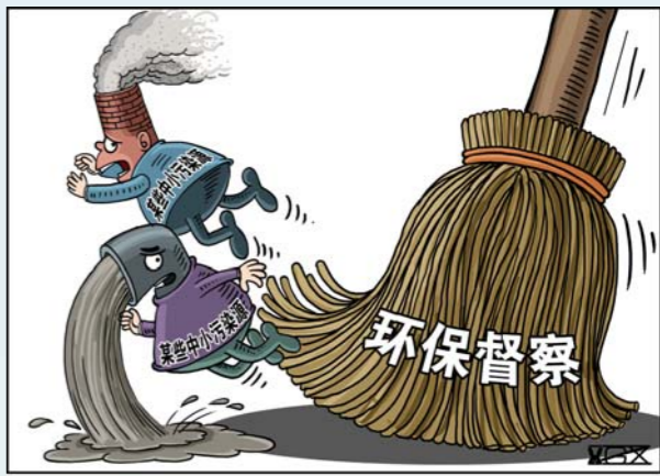
扫除“死角” 新华社发 翟桂溪 作

随着中央环保督察工作不断推进,各地整改措施不断加强,一批环境污染问题被曝光和整改。然而,在给环保工作点赞的同时也要看到,部分地区环境治理抓大放小思维依然存在,污染源监管尚存“死角”“盲区”。中小污染源的危害不容忽视。