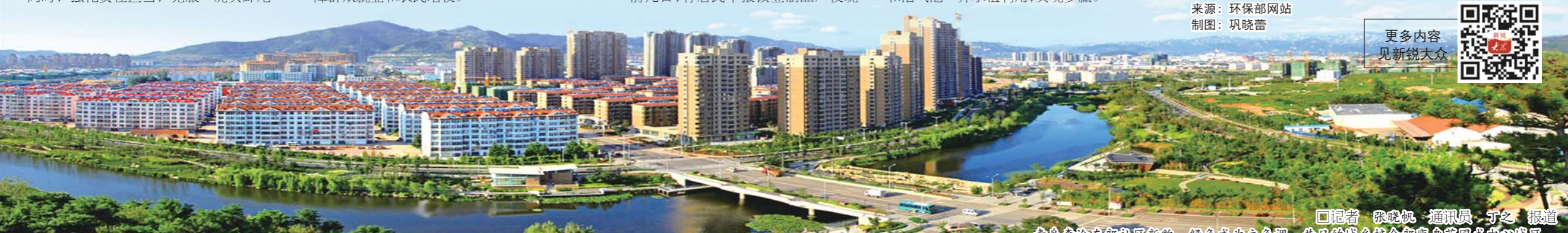
□记者 张晚枫 通讯员 于之 报道 青岛李沧东部社区新貌,绿色成为主色调。昔日的城乡结合部变身花园式中心城区。