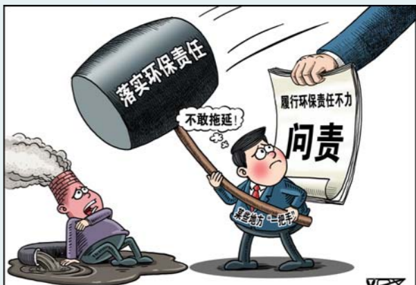
“倒逼” 新华社发 翟桂溪 作

随着中央环保督察工作不断推进,各地整改措施不断加强,一批环境污染问题被曝光和整改。然而,在给环保工作点赞的同时也要看到,部分地区环境治理抓大放小思维依然存在,污染源监管尚存“死角”“盲区”。中小污染源的危害不容忽视。