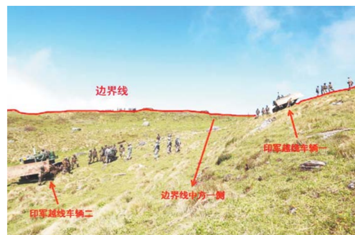
印军越界现场照片。