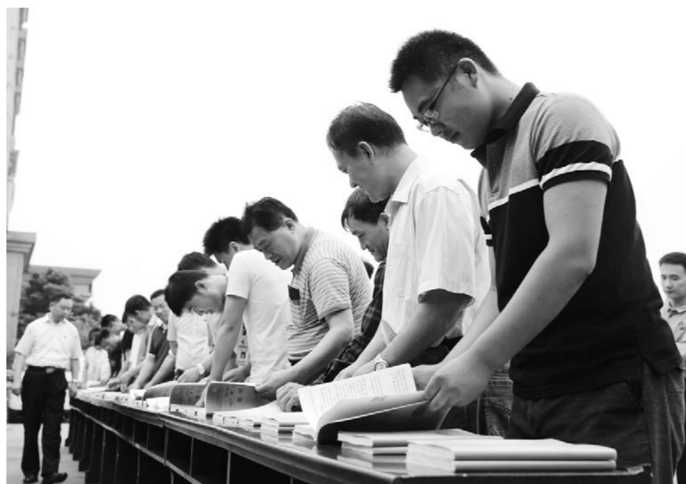
唐口煤业党委举办抄党章笔记展。

今年以来，唐口煤业不仅对现有党员活动室进行重新设计和规划，补齐学习资料和设施，规范基础资料管理，还开发并推广“过硬党支部”APP掌上党建管理平台，实现线上线下互动和联通。同时，设计搭建党建文化一条街、一走廊、一面墙，营造政治氛围。