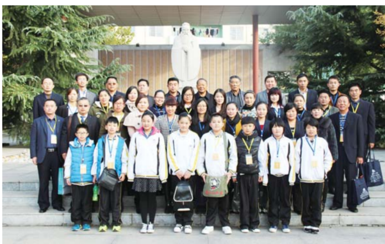
△萌山中学教师团队与昌乐二中师生合影