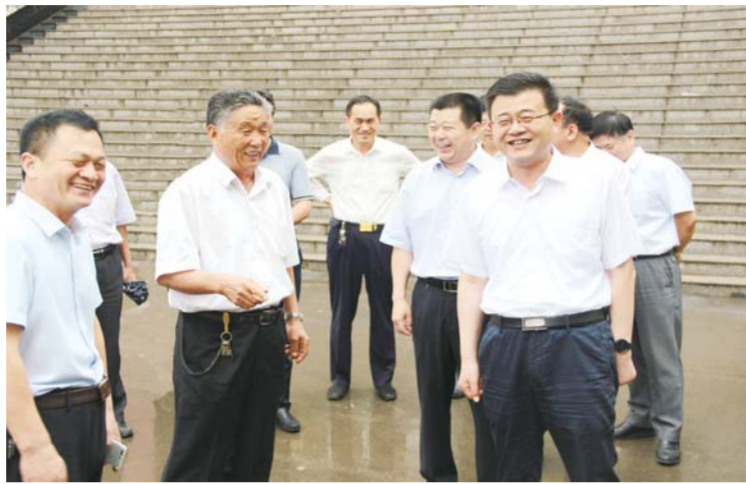
△县领导到萌山中学调研教育工作

学校以人为本，确立了“教师专业发展是学校发展的根本”的理念，制定了教师发展梯级培养计划，坚持择优录用，绩效考核，竞争高效的动态用人机制。学校搭建舞台、提供平台，让教师们尽展才华。广大教师形成了“乐教、善学、争先”的良好风气，打造了一支师德高尚、业务精湛的教师队伍。