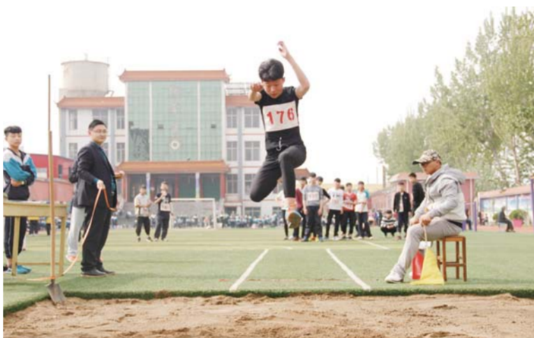
△萌山初级中学春季运动会