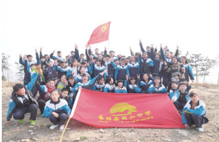
△萌山初级中学初一学生春游