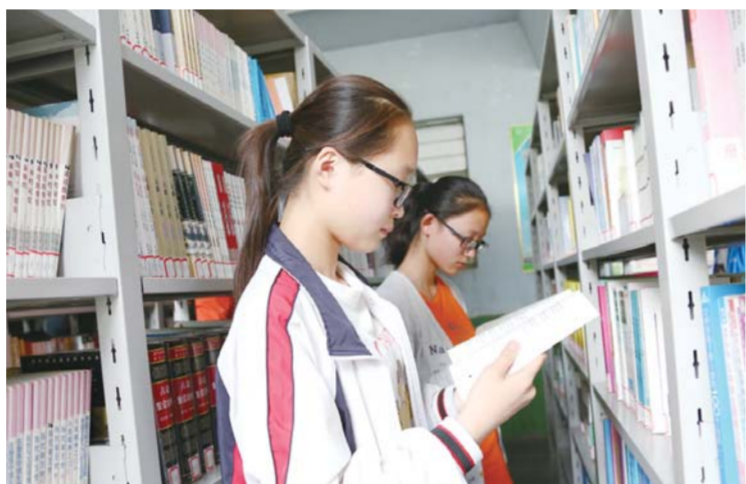
△遨游在知识的海洋里