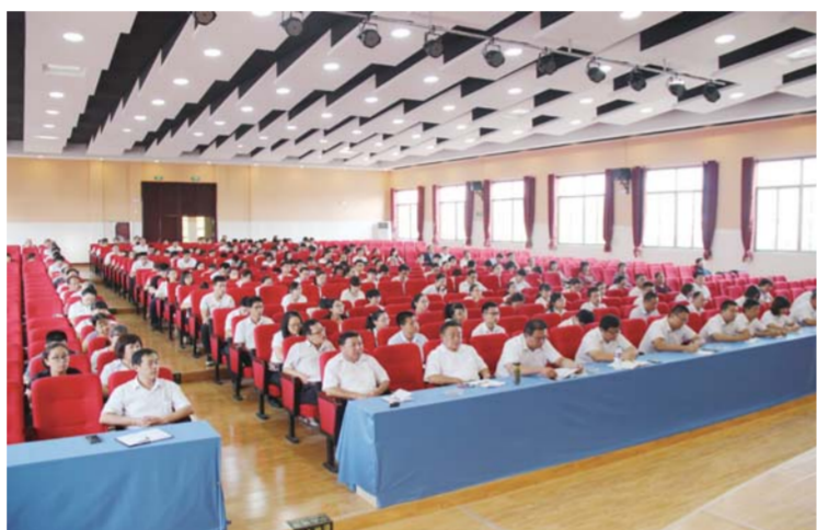
△萌山中学师德师风建设培训会