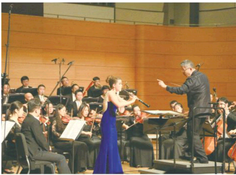
△7月23日,2017青岛·市南国际管乐艺术节闭幕式音乐会举行,管乐大师演奏经典曲目

在未来5年,三方将共同努力,赋予“青岛·市南国际管乐艺术节”更新颖的形式和更丰富的内涵,借助国际管乐艺术节系列活动,构筑国际国内顶级的管乐艺术人才聚集地,打造青岛国际管乐顶级精彩赛事。国际管乐艺术节必将成为与城市创新驱动发展相匹配的重要项目,成为市南乃至青岛享誉国际的时尚文化品牌。