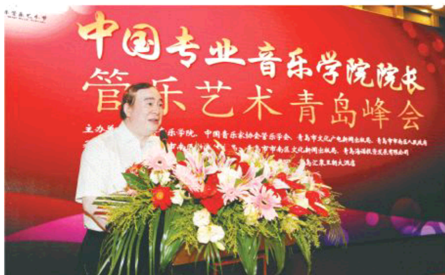
△中国专业音乐学院院长管乐艺术青岛峰会上,中央音乐学院院长俞峰等专家发言

这次高峰论坛的成功举行,全面加强了市南区与国内外管乐文化艺术的交流与合作,除了系统整合区域管乐艺术资源,整体推动区域文化的繁荣发展外,更将为中国管乐艺术更快、更好地发展推波助澜。同时,管乐艺术在市南区的普及及教育、管乐人才培养、宣传推广、作品创作与演出、文化惠民、相关产业发展方面的未来之路也会更加明晰。在开放、融合区域发展理念的引领下,打造时尚市南、艺术之岛,构筑国际国内顶级的管乐艺术人才聚集地,建立培养更多优秀音乐人才的基地,将成为市南打造时尚幸福的现代化城区的新路径。