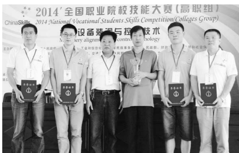
△卓越技师班学生获全国职业院校技能大赛冠军

山东劳动职业技术学院(山东劳动技师学院)是山东省人力资源和社会保障厅直属的公办全日制普通高等院校和技师学院。底蕴深厚,特色鲜明。多年来,学院以立德树人为根本,以提高教育质量为核心,以“高端引领、特色立校、内涵发展、多元办学”为指导思想,坚持培养企业一线所需高技能人才的根本任务不动摇,致力于技能人才培养的标准化、系统化和高端化,始终站在技能人才培养层次的最顶端。早在1990年,就成为全国第一所高级技工学校,成功探索了通过学校教育培养高级技工的路子。是全国最早实施“双证培养”和“双证就业”的学校。近年来又