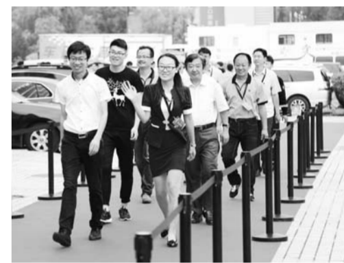
△学院师生参加世界青年技能日技能人才走红毯活动

培养卓越技能,成就出彩人生。山东劳动职业技术学院将秉承校训,坚守理念,坚定信心,遵循规律,改革创新,不断追求卓越,为“中国制造2025”培养更多的高端技术技能人才,为经济社会发展,为全面建成小康社会,作出积极的贡献。