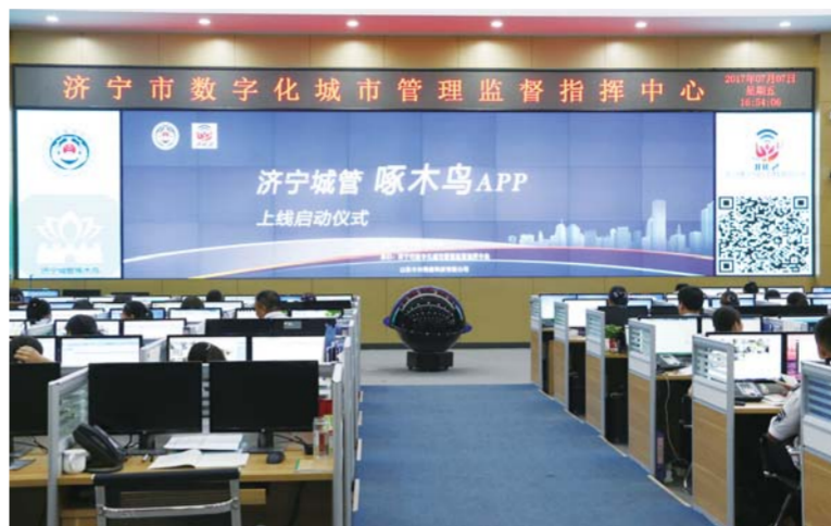
△济宁市数字化城市管理监督指挥中心