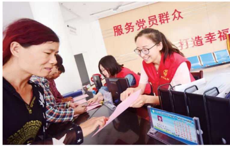
△社区工作者热情服务