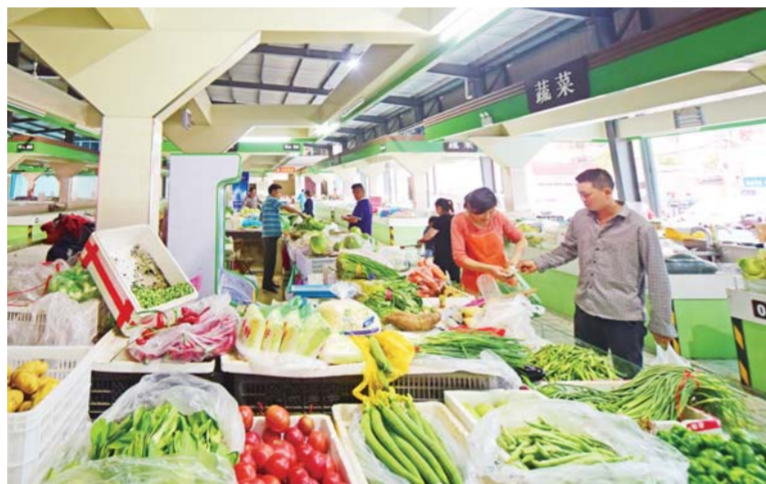
△农贸市场实行超市化管理