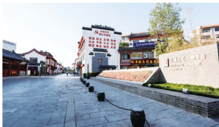
△特色文化街竹竿巷

起。”济宁市委书记王艺华说，改善生活环境、创造文明生活，将使济宁市更加宜居、宜商、宜学、宜游、宜居。