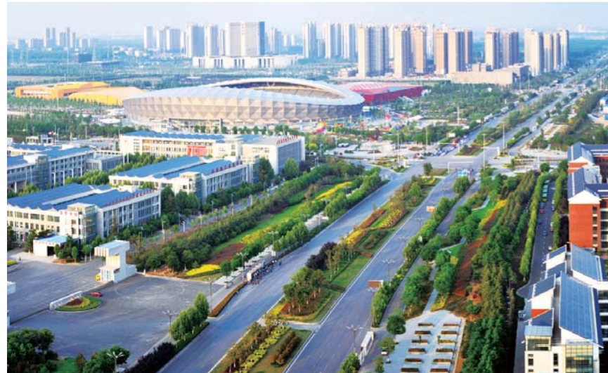
△太白湖新区城市道路整洁绿树成荫

对内，开发了“创城巡查系统”，形成动态监控、即时处置的工作机制。本系统分为前台显示和后台处置两个子系统，包括客户端和管理端两个层面。前台显示子系统，主要是通过大屏幕或电脑端即时显示各路段、各网格存在的问题和办结情况；后台处置子系统，主要进行任务派送、办结反馈、GPS定位等信息采集和数据处理工作。管理端负责任务派送、问题督办、办结反馈。