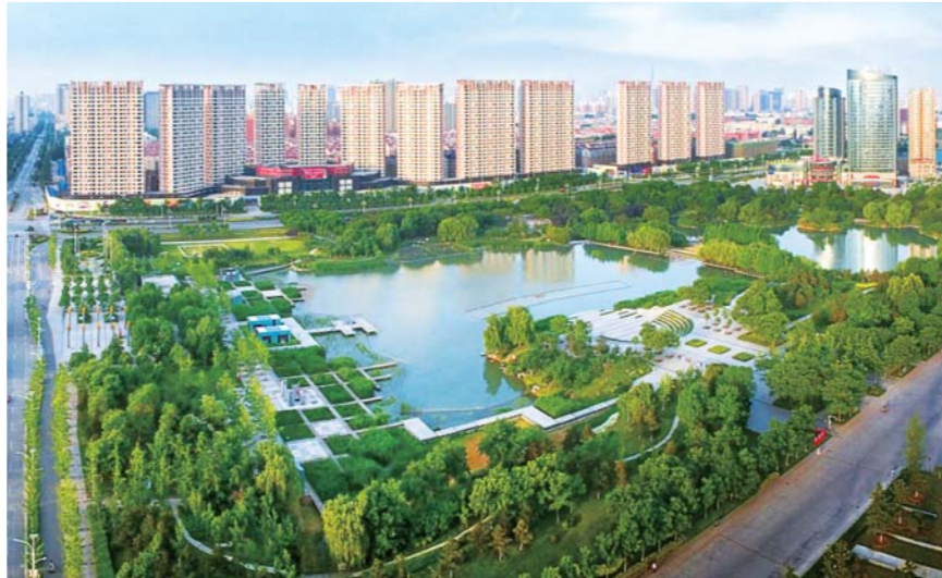
△任城湿地春意盎然