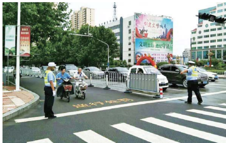
△加大不文明交通行为整治力度，交通秩序明显改善