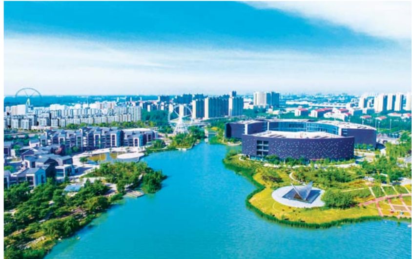
△济宁高新区科技新城