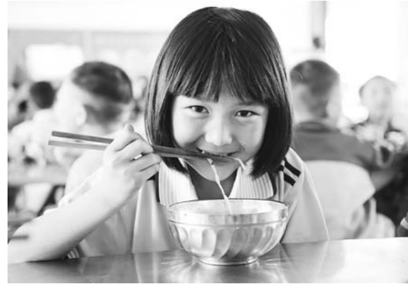
根据国民营养计划，我国将实施学生营养改善行动、贫困地区营养干预行动等六大行动，全面提升国民营养水平。（资料片）