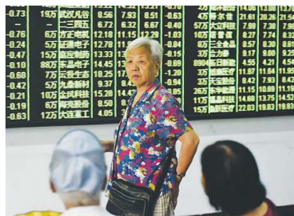
7月17日，股民在证券营业部关注股票行情。