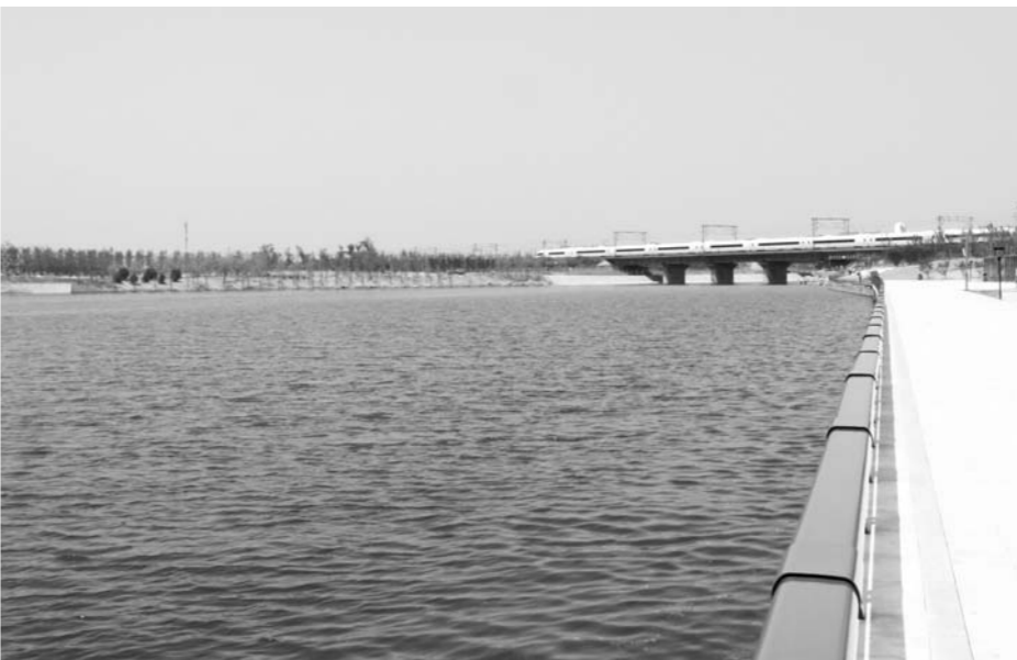
河崖头孝妇河整治后让“一泓清水还复来”，同时盘活了这座“干涩”的城，居民节假日也有了好去处。

2015年，张店区开展孝妇河综合治理工作，着力打造孝妇河流域张店段全防全控的污染防治体系，截至目前，孝妇河张店区河段治理完成总投资约1.37亿元，累计完成河道清淤46万方立方米，建设壅水坝10道，生态岛40余个，铺设沿河道路9.7km，完成芦苇、香蒲等多种植物种植。如今，孝妇河水质基本达到了三类水的要求，彻底扔掉了“劣五类”的脏帽子。